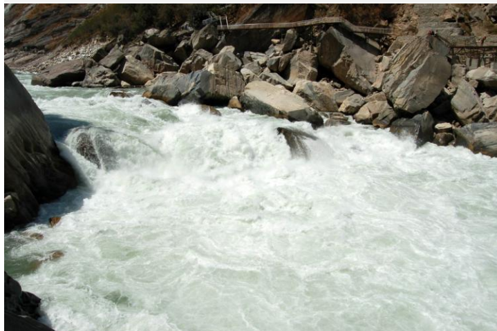
虎跳峡 by 翰林

虎跳峡位于中甸东南部，分为上虎跳、中虎跳、下虎跳3段，共18处险滩。虎跳峡是世界上著名的大峡谷，以奇险雄壮著称于世。从虎跳峡镇过冲江河洞哈巴雪山麓顺江而下，即可进入峡谷。江心有一个13米高的大石——虎跳石，巨石犹如孤峰突起，屹然独尊，江流与巨石相互搏击，山轰谷鸣，气势非凡。