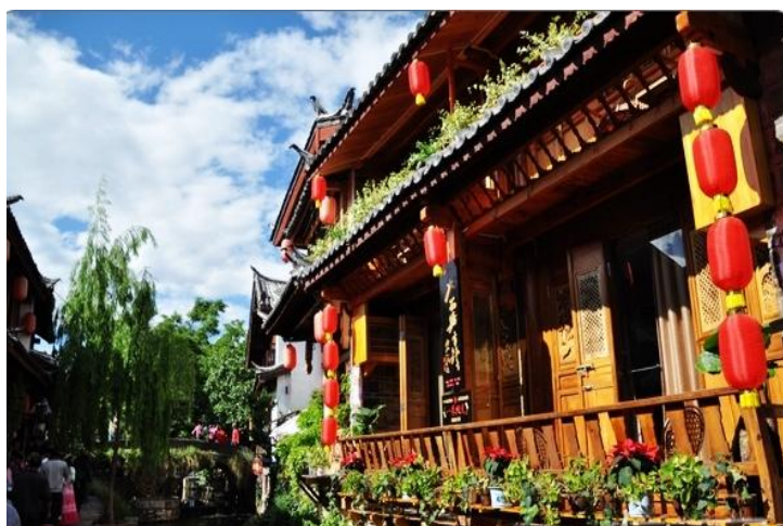
丽江古城