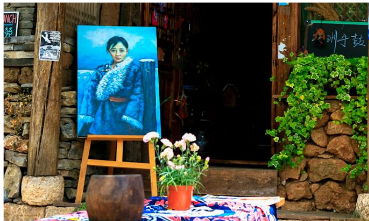
小店 by 彼岸Claire

店门口的油画就是庭院老板画给老板娘的，关于爱情的故事，丽江比比皆是。寻觅小角落里的神奇小店，感受清新文艺，发现背后的故事。