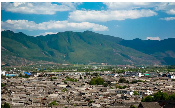
古城全景 by 彼岸Claire