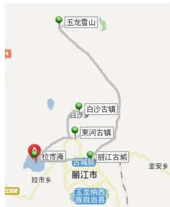
重要景点相对位置图示

束河呆腻了，可以去白沙古镇，游客更少，更安静一些，也可以留在束河。欲知束河细节，请下载百度旅游-束河攻略。