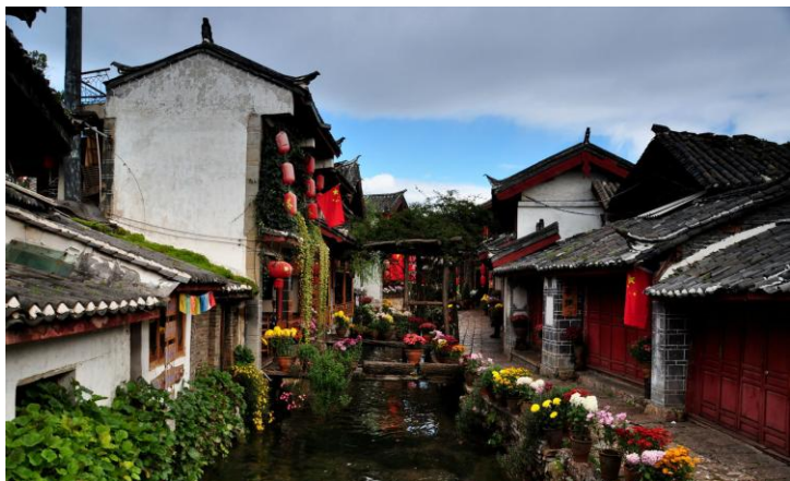
丽江河街 by 蓝月_玩转西部

你可以坐在咖啡馆被阳光洒满的落地窗前，看看书发发呆；或是漫无目的地在古城溜达，听满城《嘀嗒》的柔软曲调；或是停驻在小桥流水间，“咔嚓”好片……这就是丽江的慢生活。