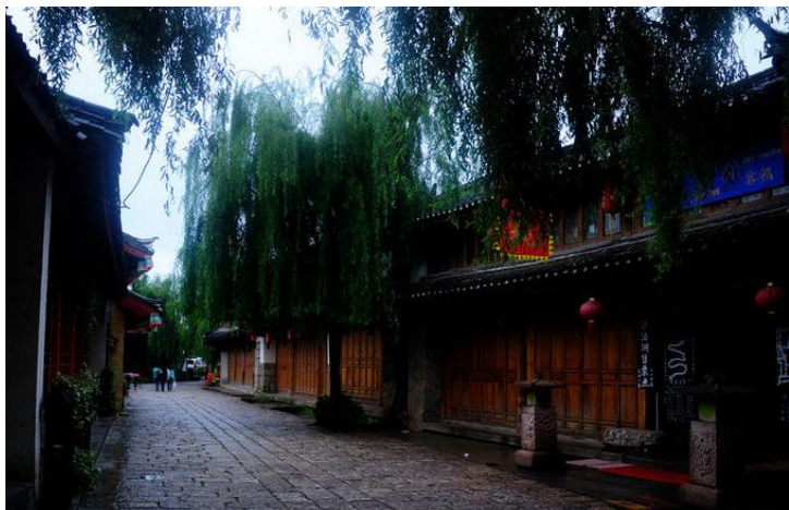
束河古镇 by zelhr