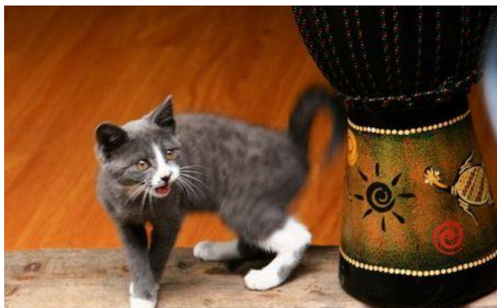
丽江 by kilometre0616