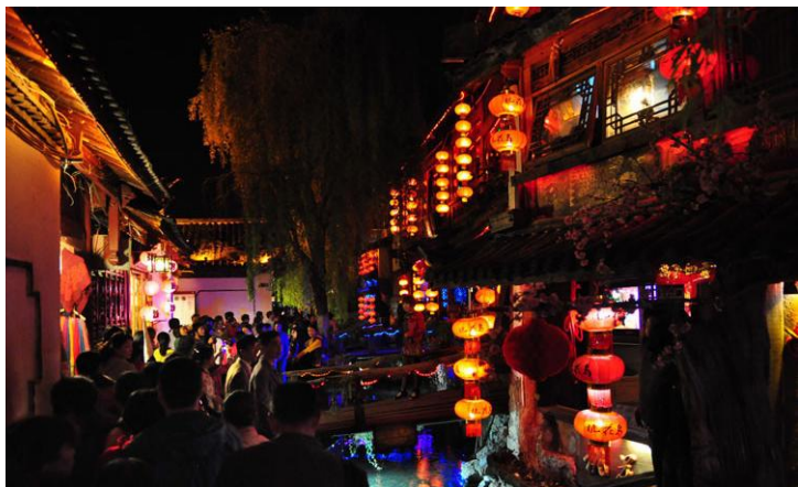
酒吧街的夜生活 by 程道放

夜幕降临，古城酒吧街散发着诱人的魔力。风格各异的酒吧，点缀以小桥流水，更显风情。不知有怎样一段邂逅等待着您？