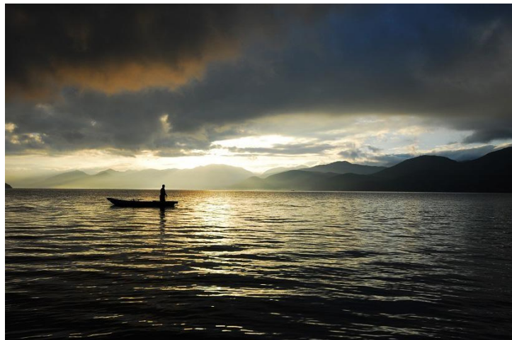
泸沽湖日出 by 飞扬一梦

坐在摩梭族人的独木舟里，静静的观赏着泸沽湖上泛起的点点涟漪，静候黎明前青灰色的天空，等待天边的淡淡红晕，守望初升红阳染满漫天金黄。