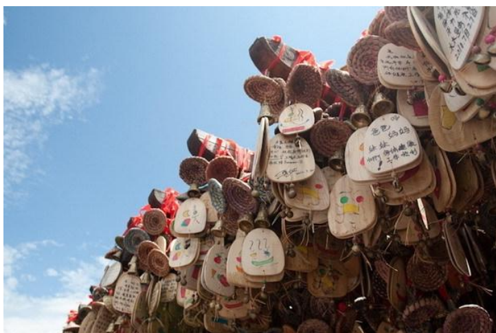
许愿牌 by kilometre0616

丽江的文化在1723年清朝改土归流政策以后，便成为一个纳西文化和汉族文化的综合体，比起金沙江西岸中甸白地（纳西东巴教发源地）的纳西人和金沙江东泸沽湖地区的摩梭人，丽江坝区的纳西社区更多的受到了中原汉族文化的影响和同化。