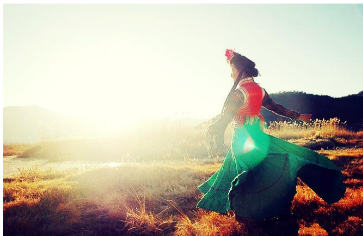
摩梭族姑娘

租自行车30元/天，电动自行车80元/天，也可以租当地人开的面包车，150元左右一天。