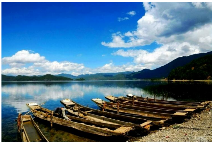
泸沽湖畔

泸沽湖素有“高原明珠”之称，是一个未被污染的处女湖。湖中各岛婷婷玉立，形态各异，林木葱郁，翠绿如画，身临其间，水天一色，清澈如镜，缓缓滑行于碧波之上的猪槽船和徐徐飘浮于水天之间的摩梭民歌，使其更增添几分古朴、几分宁静。这里就是传说中的女儿国，摩梭人世代生活在泸沽湖畔，至今仍保留着由女性当家 and 女性成员传宗接代的母系大家庭，以及“男不婚、女不嫁、结合自愿、离散自由”的母系氏族婚姻制度（俗称走婚）。泸沽湖门票为100元。