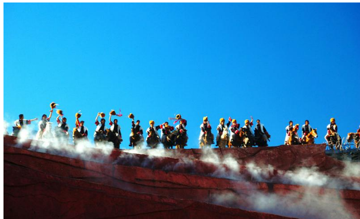
民族表演

《印象丽江》、《丽水金沙》以及纳西古乐的表演者们，用他们原生的动作，用他们质朴的歌声，用他们滚烫的汗水，与天地共舞，与自然同声，带给你心灵的震撼。