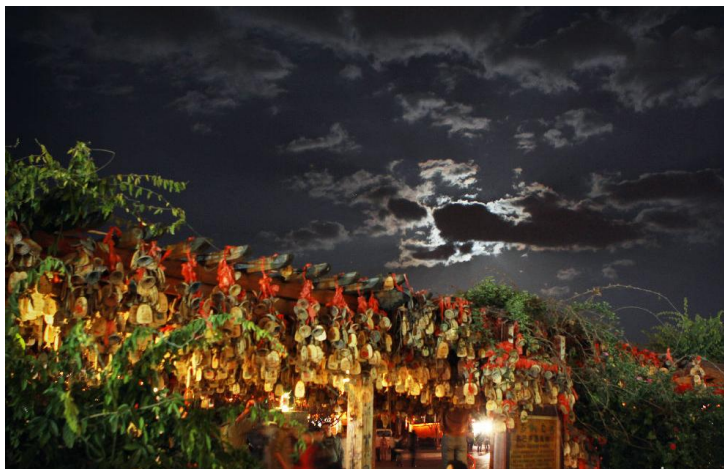
丽江的夜色

在六天时间里，尽情感受滇西北，体验纳西文化逛古镇，看雪山、草甸等经典的高原风光。跟度小游徒步虎跳峡、香格里拉、梅里雪山、雨崩，六日畅快游周边！本线路适合爱徒步的户外爱好者。