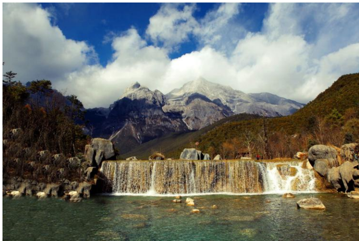
玉龙雪山上的蓝月山谷

交通： 1、出租车（100元左右，回程价格差不多）2、最经济：在红太阳广场旁坐7路车至玉龙雪山站（10元），班次较少 3、包车去玉龙雪山（夏利车：大约100-150元）4、最省事：参加当地一日游团。游览后返回大研古城。