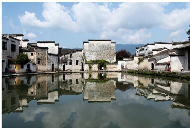
如画宏村 by 闻香知

全村现完好保存明清民居140余幢，著名景点还有：南湖春晓，书院诵读，月沼风荷，牛肠水圳，双溪映碧，亭前古树，雷岗夕照等。树人堂、桃源居、敬修堂、德义堂、碧园等一大批独具匠心、精雕细作的明清古民居至今保存完美。