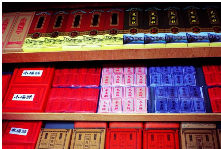
徽州糕点 by 颍记的华年

腊八豆腐是安徽黟县民间风味特产，在春节前夕的腊八，即农历十二月初八前后，黟县家家户户都要晒制豆腐，民间将这种自然晒制的豆腐，称作“腊八豆腐”。