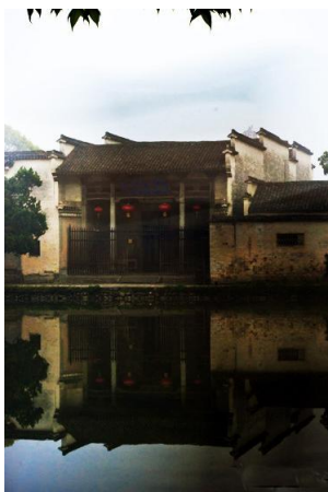
南湖书院 by fangyuchen1989

书院由志道堂、文昌阁、启蒙阁、会文阁、望湖楼、祗园六部分组成。“志道堂”是先生讲学之场所；“文昌阁”奉设孔子文位，供学生瞻仰膜拜；“启蒙阁”乃启蒙读书之处；会文阁供学子阅读四书五经；“望湖楼”为教学闲暇观湖休息之地；“祗园”则为内苑。书院前临一湖碧水，后依连栋楼舍，粉墙黛瓦、碧水蓝天、交相辉映。