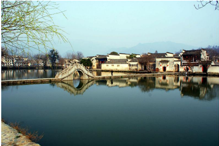
南湖 by 漂菲