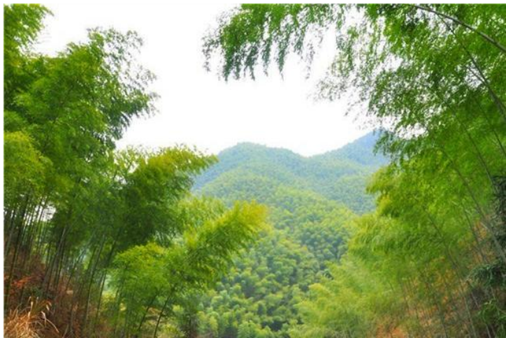
木坑竹海

木坑的片片竹海，因为《卧虎藏龙》才渐渐为人所熟知。满山的翠竹，走在落地的竹叶上沙沙作响。给人一种超然世外的美好感觉。美丽的景色不止在于眼观，还要用心去感受。宏村的如画之景，宏村的静谧之美，都构成了旅行中的一幅幅美好画面。