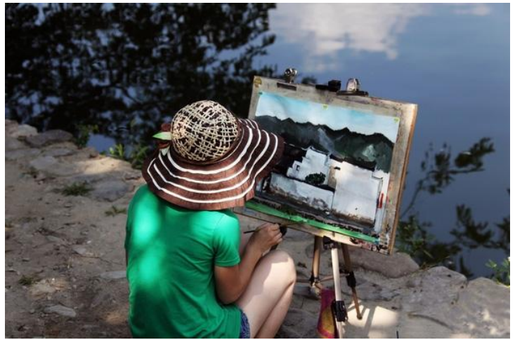
写生的学生 by 闻香知