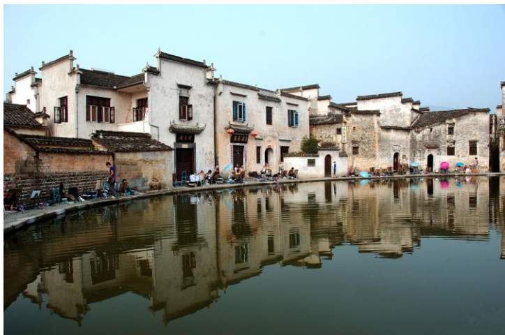
写生的学生们 by fengyy5

最好提前联系好村里的住宿，会有老板亲自到门口来接，门票可以打九折。也可以在同程、携程等网站预订电子票。宏村的管理非常严格，不要相信当地人带进村逃票，一定正规买票，以免上当受骗。