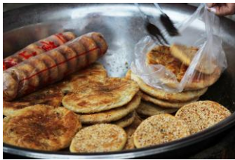
梅干菜烧饼 by ppaall008