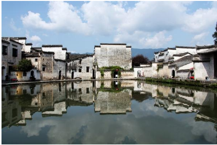
如画宏村

雷岗山，位于宏村景区内，深度游的驴友可前去探访，从后街28号的清和月客栈向北走五份钟即可上山，山上有大片古树，200-300年的古树居多，山上有一个平台，可拍摄宏村全景。四季可赏，景色不同，十分有野趣。