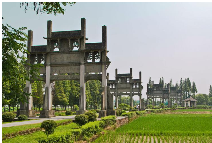
棠樾牌坊群

最后是红白古树，这是两棵有500年树龄的古树，一棵叫枫杨树，一棵叫银杏树，在当地是吉祥如意的象征，如此，在美好的祝福中结束一天行程。