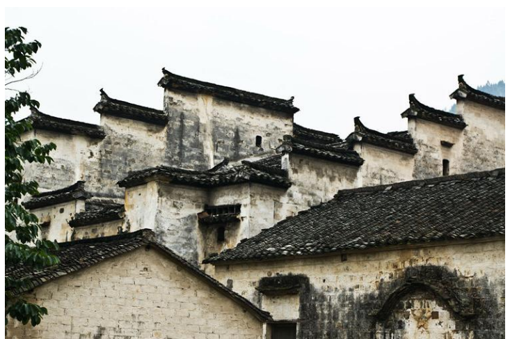
徽派建筑