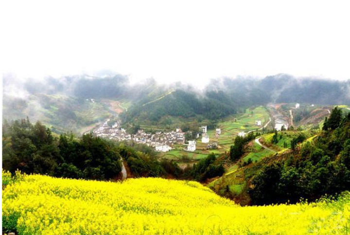
油菜花海

没有《卧虎藏龙》的木坑竹海一样精彩，春日里盛开的油菜花，让这个春天更添了美好的色彩。