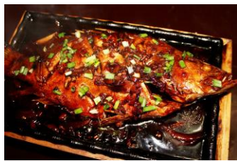
臭鳊鱼 by ppaall008