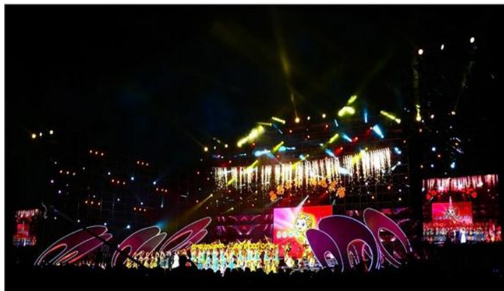
水晶节 by shuchan