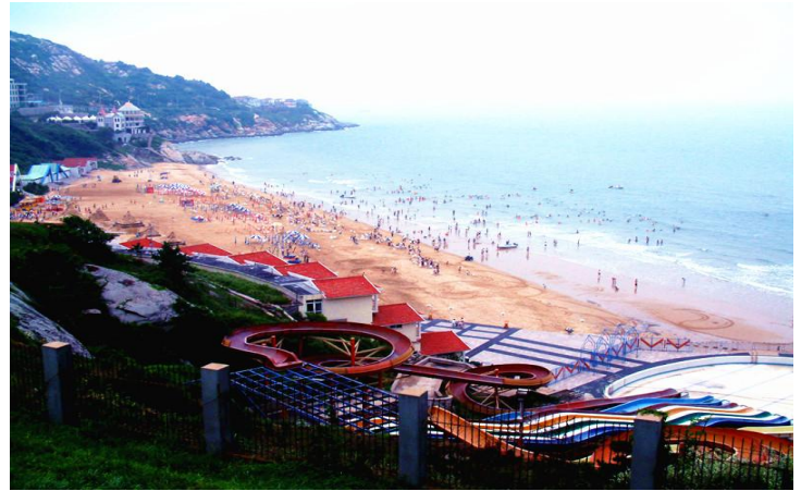
连岛海滨浴场