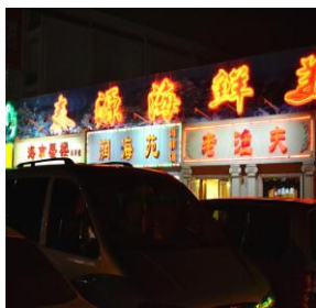
美食城 by 天蝎酷宝宝