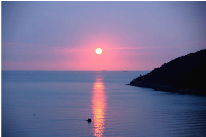
日出 by 好多逗号