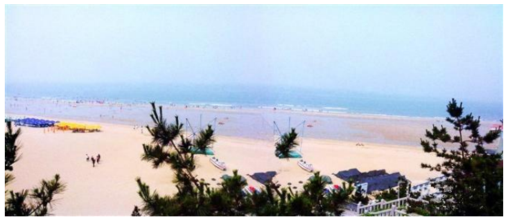
海滨浴场全景

连岛海滨浴场，是江苏省最大的天然优质海滨浴场，又称苏马湾。主要由大沙滩浴场和苏马湾浴场两部分组成。