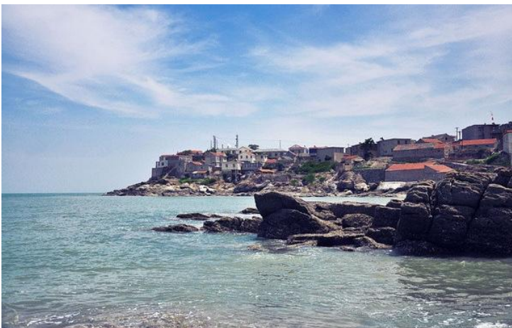
连岛 by shuchan