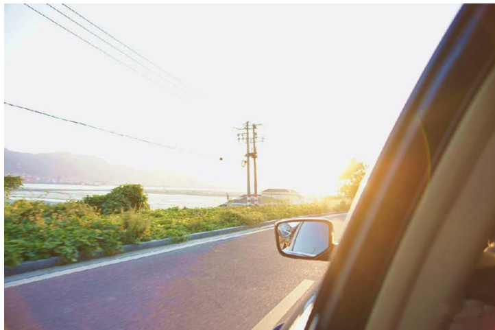
路上的风景 by 好多逗号

“闲在路边的椰树叶，它有一整天的时间，仰起海风吹红的脸，悄悄飞去了东南边，因为我们最浪漫的相片，我有冷落的直觉，原来冲动的情，就是和你看海……”