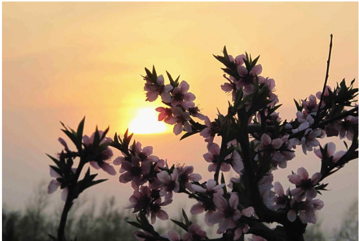
花果山的海棠花 by 驻马店市九小

坐落于一片金镶玉竹之久的金留玉竹是竹子里面的珍品，嫩黄色的竹竿上每节都有一条绿色的浅沟，好似在金版上镶进一块块碧玉一般，美丽淡雅。