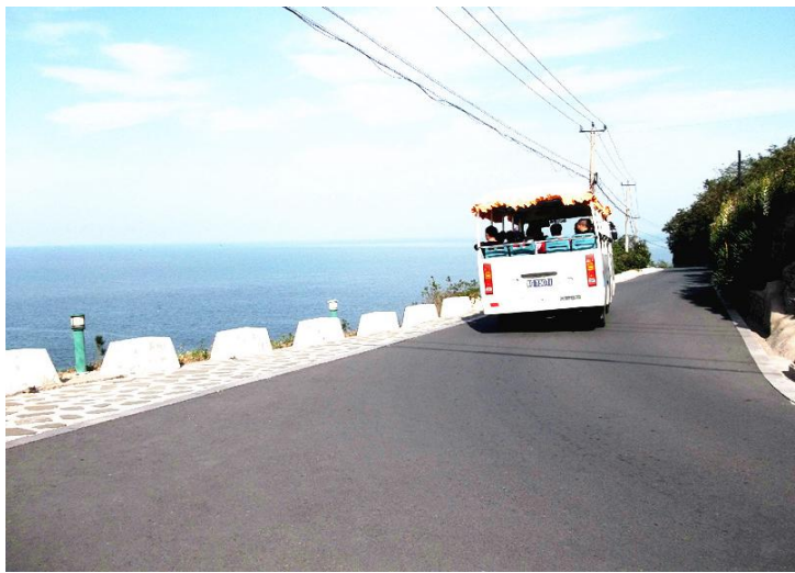
第一次看海 by 凡辉1986