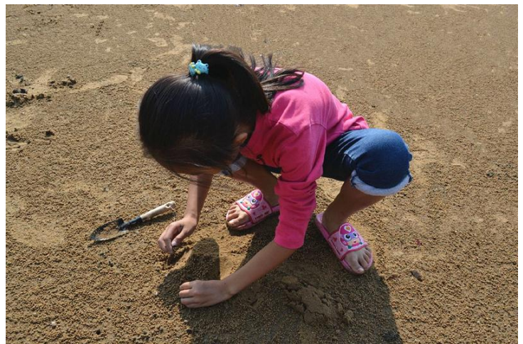
找贝壳 by 天蝎酷宝宝