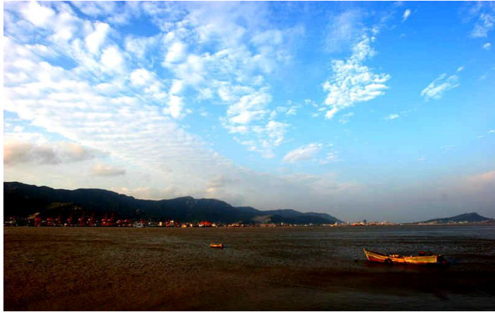
沙滩边 by 烟灭就分手008