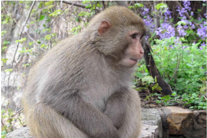
猴子

南天门旧有关帝庙，毁于日寇的战火，林则徐曾在鸦片战争前到这里观赏过，并留下了三首著名的七律。