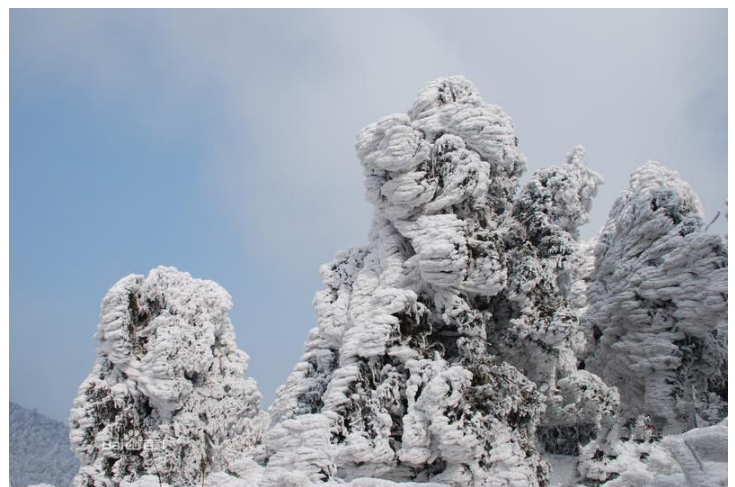
南岳雾凇