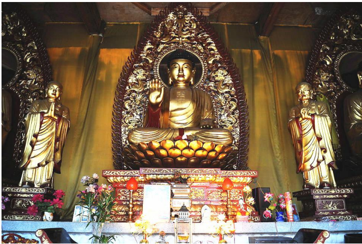
方广寺佛像 by 文and文兄