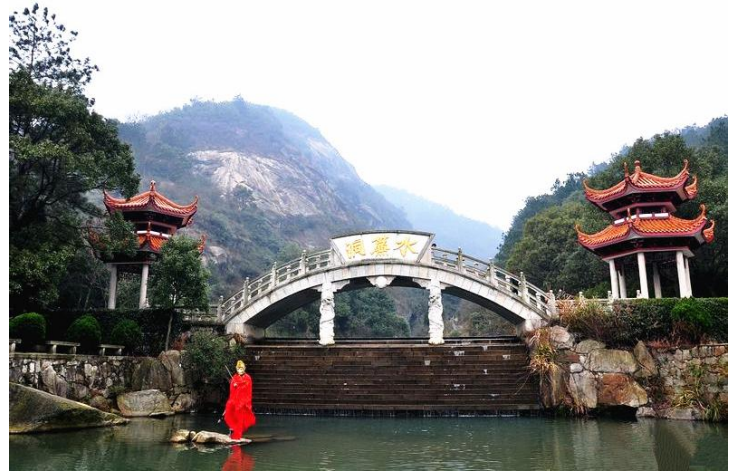
水帘洞 by seabinghe