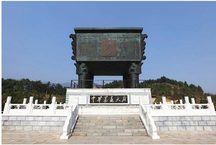
万寿大鼎 by 唱天黑黑的龙猫