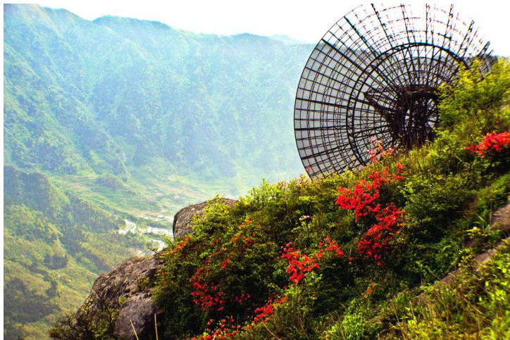
南岳山花

当然，12月至次年2月初到衡山，则可以欣赏到著名的衡山雾凇（雪景）。由于特殊的气候条件，衡山有着南方其他地方都没有的雾凇奇观。