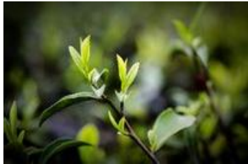
云雾茶 by 文and文兄

云雾茶是衡山的特产。游衡山使人精疲力尽，买些云雾茶带回去，沏上一壶，既可以生津解乏，又是极佳的纪念品，当茶叶的淡淡清香在齿颊之间悠悠流转，衡山的秀丽风光似乎又历历在目。