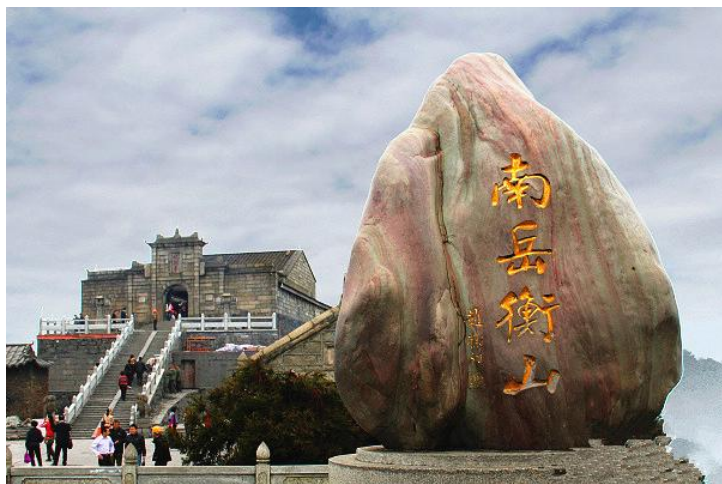
南岳衡山 by 文and文兄