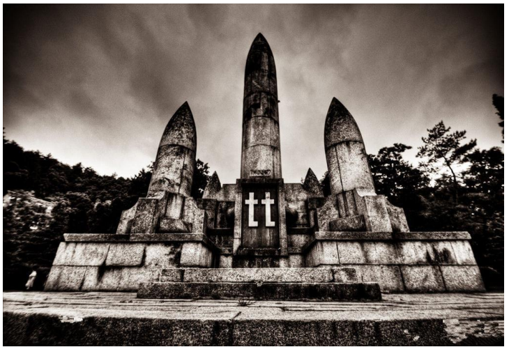
忠烈祠 by 唱天黑黑的龙猫

南岳忠烈祠距南岳古镇4公里，这里峰峦错峙，松柏掩映，溪水环抱，公路盘纤，既山重水复，亦爽垲向阳，是理想的建祠之所。忠烈祠于1938年筹建，1942年落成。是我国大陆唯一纪念抗日阵亡将士的大型烈士陵园，忠烈祠依山而建，规模宏大，整个布局为方体，前低后高。祠内花岗岩石板大道和276级石磴衔接，将牌坊、“七七”纪念塔、纪念堂、致敬碑、享堂从下而上组成一体，长242米，宽60米，占地面积14400平方米。忠烈祠其上为蒋介石游南岳的纪念林，两侧是翠绿山峦，四周是参天古松，把整个建筑紧紧地环抱于山中，全祠共有13座大型烈士陵墓，安葬第九战区抗日阵亡将士的遗骸。