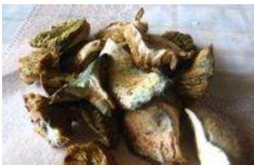
雁鹅菌 by 文and文兄

南岳山上有菌数十种，唯有雁鹅菌是上品。雁鹅菌吐浅棕色，形状如伞，小至铜钱，大至菜碗，均质松肉肥，馨香甜美，鲜嫩可口。下面、调汤、炒肉，无一不宜。