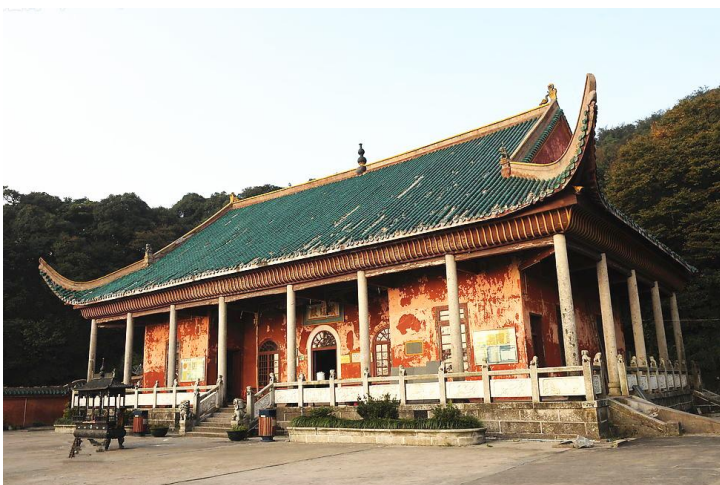
天下第一江山 by 唱天黑黑的龙猫