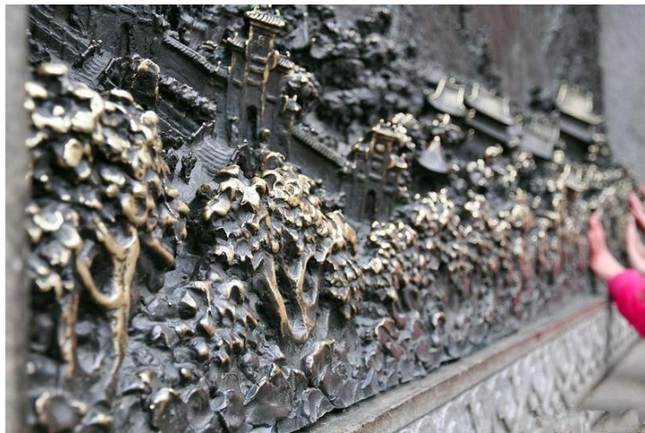
南岳庙铜刻

第一天可以先从南岳庙开始旅程，之后前往忠烈祠参拜抗日将士忠骨，然后攀登祝融峰顶极目四望，峰高眼阔，胸怀无际。脚下群峰如浪，绿涛起伏。其后沿小道下到磨镜台。在这里远望，南岳景色尽收眼底，台旁古松盘桓，台前壑谷幽深。下山前您可以到水帘洞看看。晚上返回衡阳市区住宿。