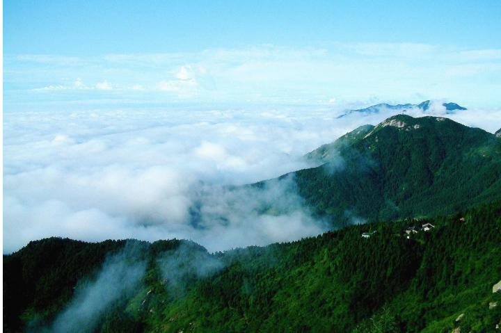
祝融云海 by rucer214

祝融峰为南岳最高峰，海拔1290米，站在山顶，遥望云海，心生“一览众山小”的感慨。