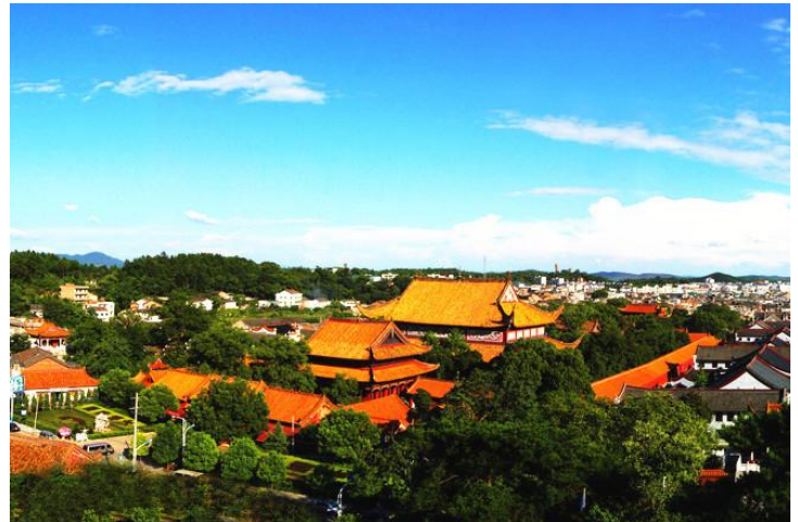
南岳大庙 by 唱天黑黑的龙猫