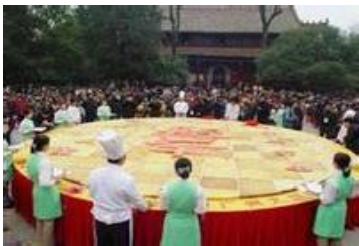
巨型寿饼 by 文and文兄

南岳寿饼已有四千多年的历史，即大舜南巡时尝过的“豌菽饼”，后经各部落首领推介，取名“万寿饼”，从此誉满寰中。每逢南岳香期或斋会，争相供奉，约定成俗，遐迩闻名。万寿饼融合了南岳高僧高道的养生秘笈，口味甜而不腻，香而爽口，老少皆宜。