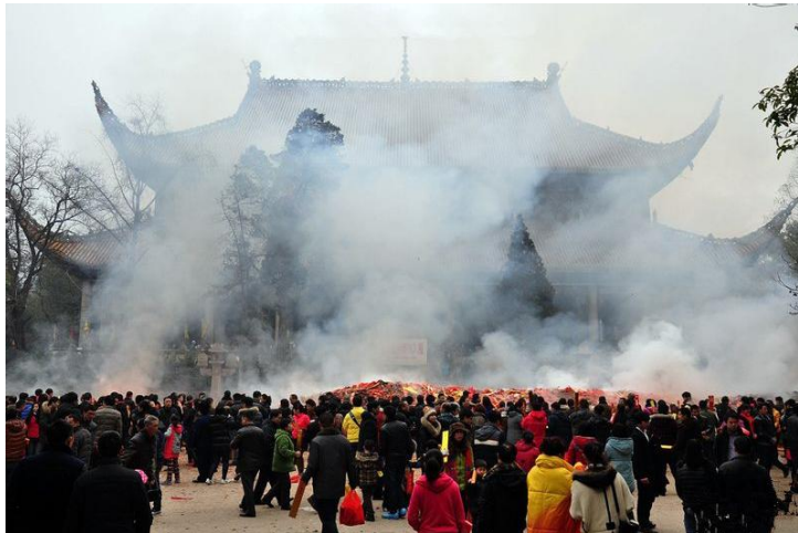
香期盛况

内容： 香期乃南岳最有特色的民俗之一，指民间百姓在七月至九月这个时期采取特定形式到南岳来朝香。它是一种民间祭祀圣帝的活动。自唐天宝元年（742年）开始，一直流传至今。这些香客来自四面八方，近者来自省内各地，远及江西、湖北、广东、广西。尤其是南岳俗定农历八月初一为南岳圣帝神诞，所以这一天是香期的最高潮，来岳进香朝拜圣帝的往往多达十万之众。