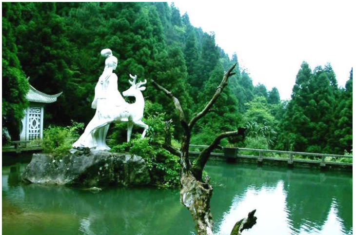
麻姑湖 by 文and文兄

麻姑仙境位于天柱峰下，相传为南岳魏夫人侍女麻姑飞天祝寿的地方，它采取“点石成景、引水造景、修路出景、植树添景”的造景手法，使该景点成为名符其实的人间仙境。对外开放以来，游客络绎不绝，主要景点有麻姑祝寿、绛珠亭、盗桃石、卧虎石、灵芝石等。