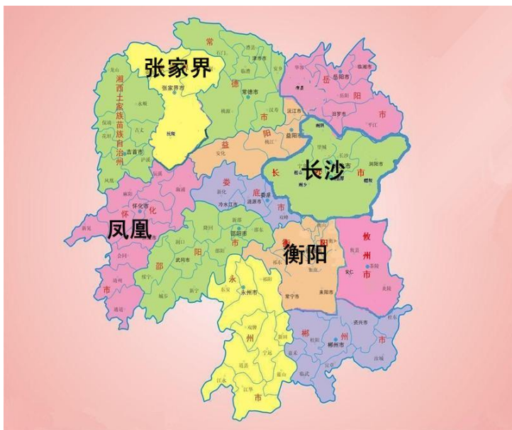
湖南省行政区划图