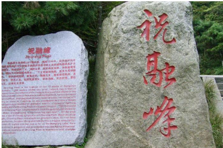
祝融峰石刻 by rucer214

祝融峰是南岳最高峰，海拔1290米。祝融峰是根据火神祝融氏的名字命名的。峰头花岗岩裸露地表，黑石嶙峋，峰背巨崖，壁立千仞；望月台侧，奇石堆叠，耸出十余丈，成为峰顶最高点。峰腰到峰麓，松杉环绕，郁郁葱葱，深绿无际。登祝融峰顶，极目四望，峰高眼阔，胸怀无际。脚下群峰如浪，绿涛起伏，湘江如带，弯曲成五条白练，遥向祝融，俗称“五龙捧圣”。