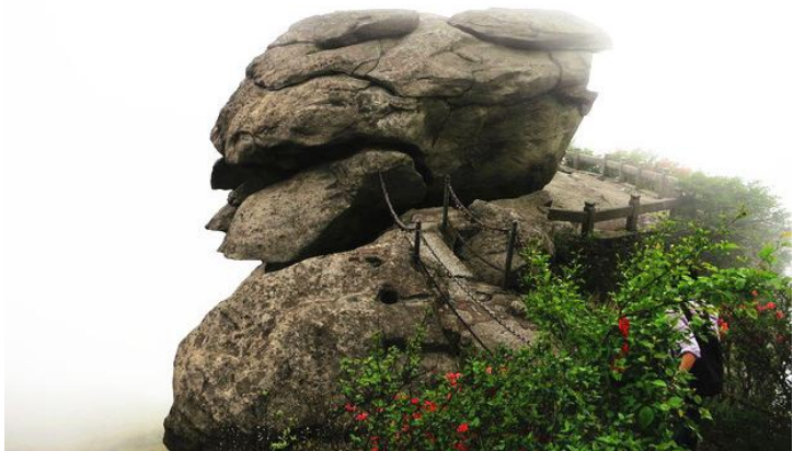
会仙桥 by 文and文兄

会仙桥，俗名试心桥，又叫仙人桥，位于祝融峰巅的青玉坛，坛基是一片平坦的大岩石，可容数十人。岩下有大小两石，小石仅大石半，中有石桥可通，桥极险窄，仅可容步，人多不敢过，故又名试心桥。据道家言，青玉坛是乌青云所创，为第二十四福地，乃群仙聚会之所而名。站在会仙桥，还可望见祝融峰侧一巨石，宛如乌龟，人称“金龟朝圣”。明人卢仲田的《会仙桥》诗云：“烂柯仙人久不来，一桥空对百花开。我来桥上寻遗子，云满空山月满台。”