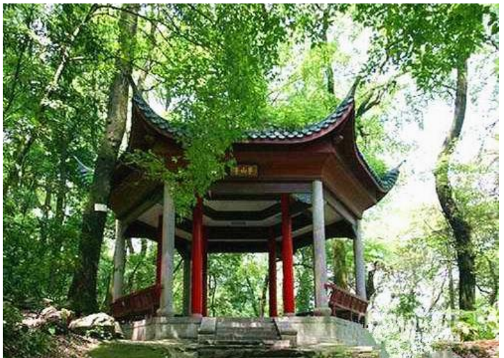
半山亭 by 日暮漂泊

半山亭，位于南岳衡山半山腰。为殿堂式四方形凉亭，彩檐高翘，古朴雅致，是游人上山常驻足憩息之所。从南岳庙后门沿登山公路穿过忠烈祠，便是半山亭，由于它位于南岳区和祝融峰的中间，上下各为十里，故名。半山亭周围的参天古松最具风情，由于长年被北风吹刮，枝干一概朝南，似乎在向游人频频招手，引人入胜。立在半山亭门庭眺望，号称“南天一柱”的天柱峰直插九霄；向南俯望，便见湘江逶迤，波光如练；向上仰视，隐约可见白云深处的南天门。