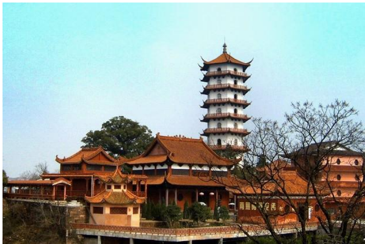
南台寺 by 文and文兄

南台寺在郴钵峰下的三生塔南面，号称“天下法源”，距福严寺2公里不到。南朝梁天监年间海印禅师创建此寺，唐天宝年间禅宗七祖弟子希迁和尚将它定名为南台寺。南台寺风景宜人，古寺四周绿树环抱，寺内有虎耳草、七里香等奇特植物，最稀奇的是一种叫雪花的高山植物，它枝干低矮，开着金黄色的花，却不长叶子。南台寺被日本佛教曹洞宗视为祖庭，清光绪二十九年（1903年），日本曹洞宗高僧梅晓来南台寺接连宗源，赠了不少藏经给南台寺，留下了“梅晓赠经”的佳话。