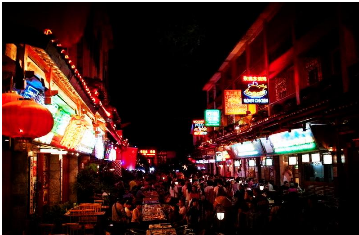
西街夜景 by 左岸红枫

西街适合晚上去，邮局那里算是西街口，沿着西街一直走可以走到漓江边，有各种各样的小店，卖的东西跟各地景区的这样的小街卖的东西差不多，可以在里面找找有当地特色的。