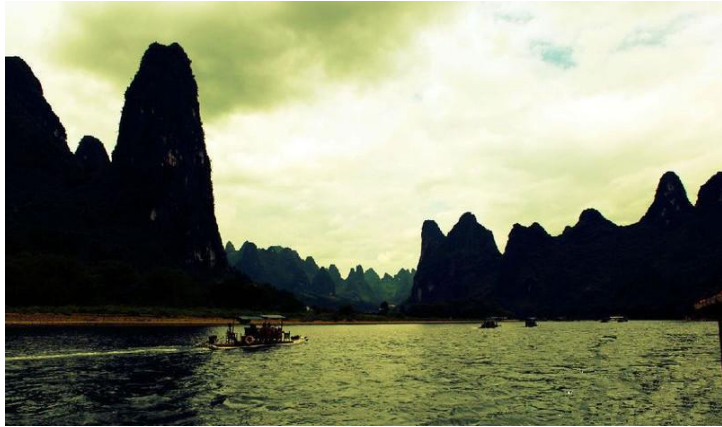
泛舟游漓江

“愿做桂林人，不愿做神仙”这也许是对桂林最高的赞美了，乘一叶扁舟，荡漾在漓江之上，你也可以坐一日快活神仙！