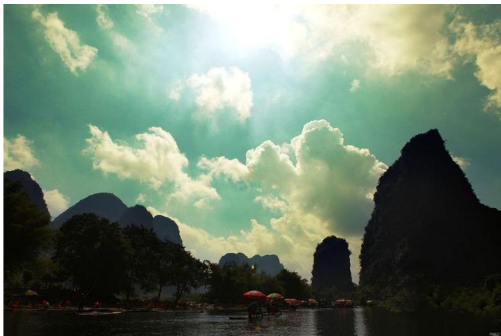
泛舟游漓江