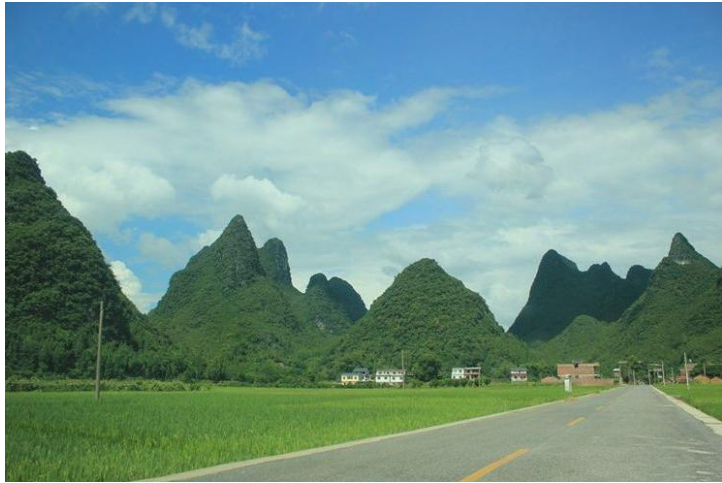
路过的村庄田野 by August初七