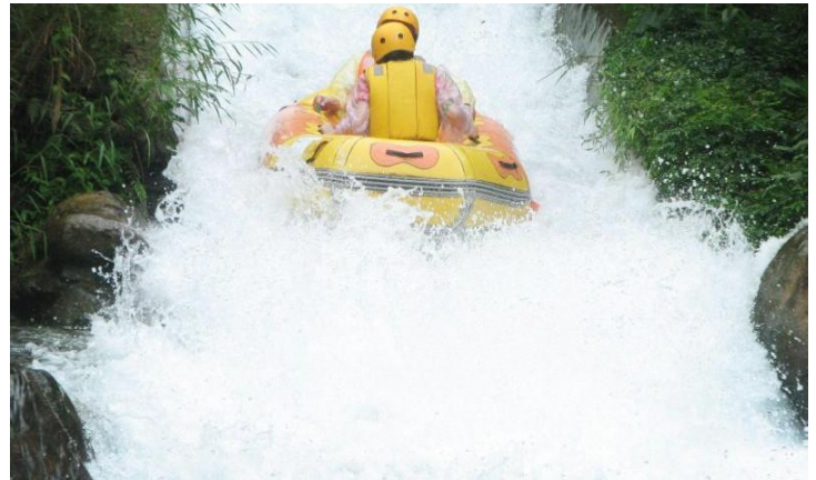
龙颈河漂流

桂林的旅途是恬静闲适的，而龙颈河的漂流则可以为你这趟闲适的路途增添一份刺激的狂欢。