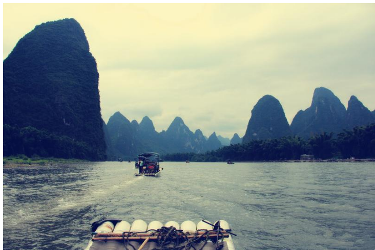
山水之间 by 艾雪儿1014

在漫长的岁月里，桂林的奇山秀水吸引着无数的文人墨客，他们在此写下了许多脍炙人口的诗篇和文章，刻下了两千余件石刻和壁书。