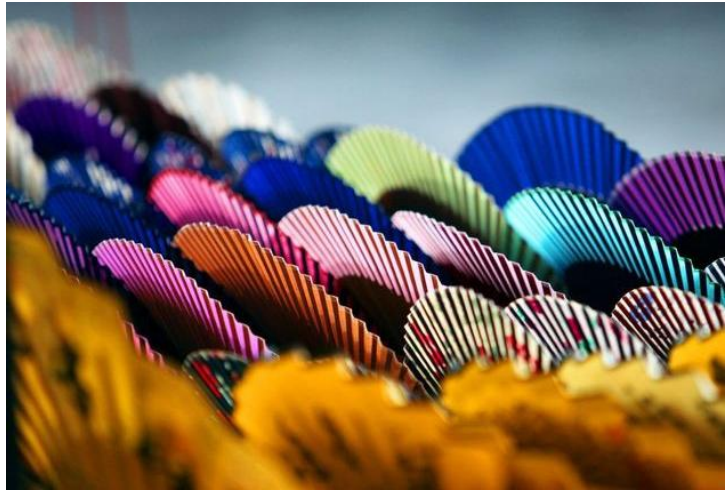
纸扇 by Bluephants

桂林是个多民族聚居的城市，壮、回、苗、瑶、侗等28个少数民族占全市总人口的8.5%左右。全市聚居的壮、苗、瑶、侗等少数民族，许多的少数民族，他们虽然生活在整个华夏民族的文化气氛中，却还保持着自身的民俗，包括服饰，食物，节日，宗教信仰，甚至语言文字。