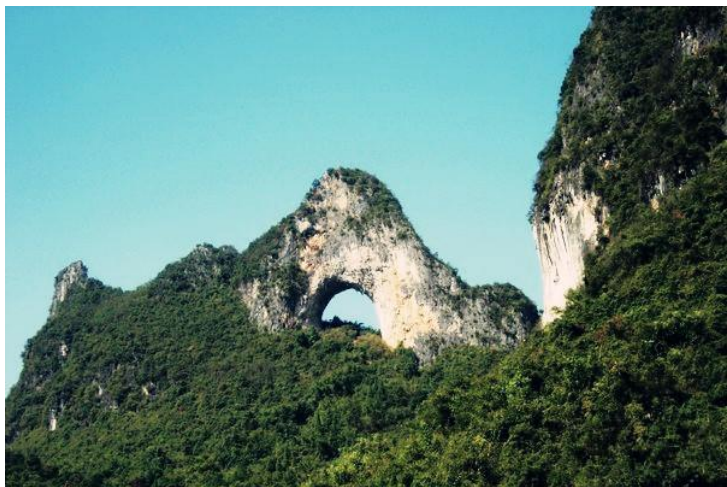
月亮山 by 徐狮子

路线： 在阳朔县城租一辆自行车，往丁厄圆盘→石马圆盘→高田镇方向沿公路一直骑可以欣赏路边风景，来回大概需要一个下午