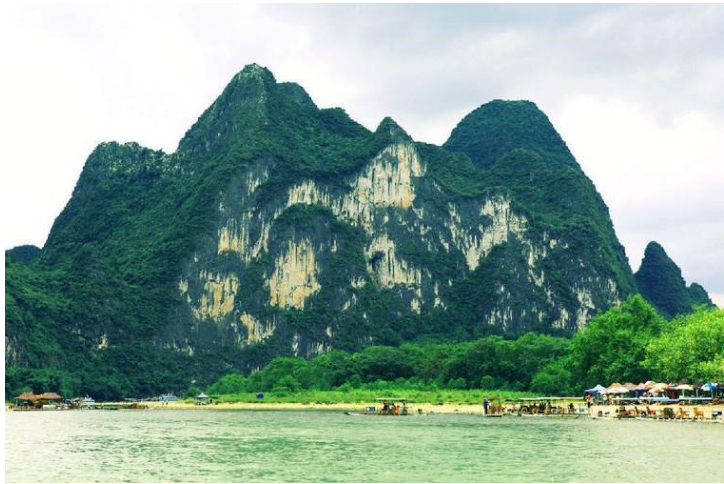
九马画山 by Bluephantoms