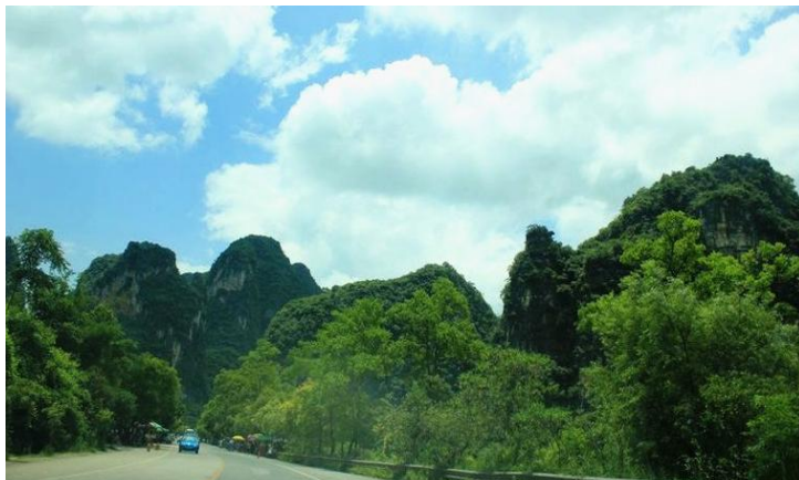
十里画廊 by August初七

观赏十里画廊的最好方式就是骑行，来回的十六公里路程，风景如诗如画，而且路况很好，骑行于其中定会让你心情大好。