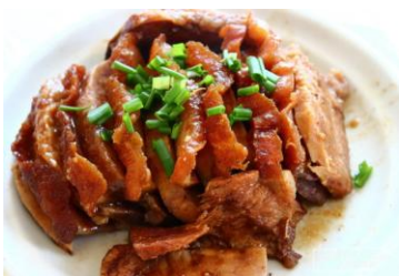
荔浦芋扣肉 by JEEP犟驴

荔浦芋扣肉是桂林传统宴席名菜。采用桂林特产荔浦芋、带皮五花肉、桂林腐乳和各式佐料精煮而成。色泽金黄，芋和肉皆松软爽口，浓香四溢。肥而不腻，瘦而不塞牙的是上品，荔浦芋头则有解腻的功效。在很多餐厅都能吃到。