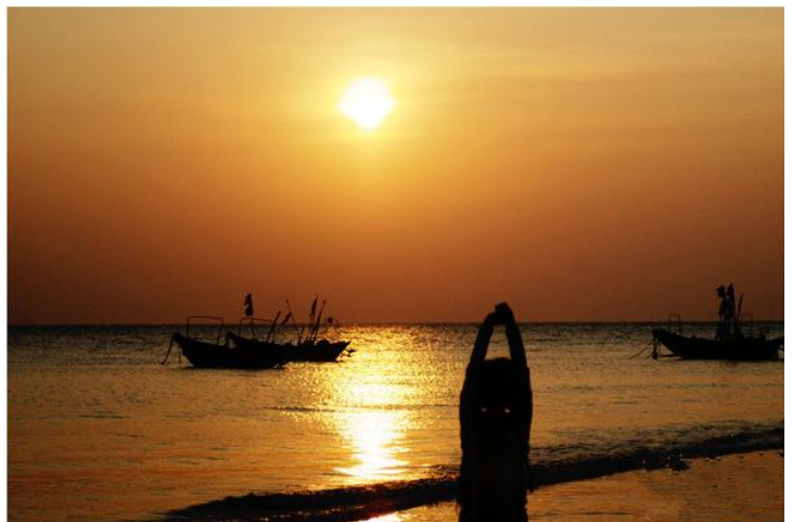
落日 by 徐狮子