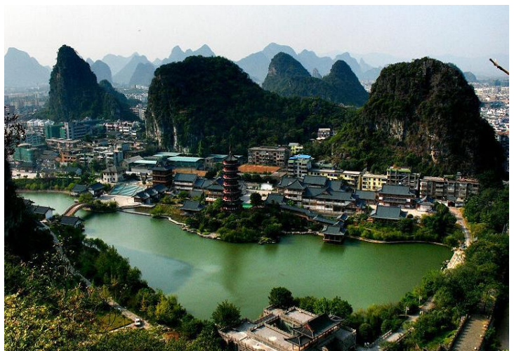
叠彩山 by 阿文四郎