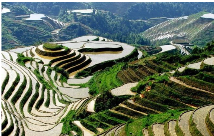
龙脊梯田