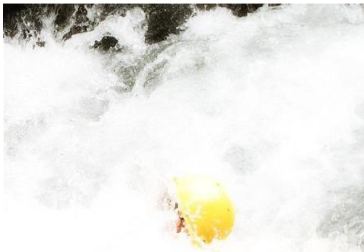
龙颈河漂流 by 颓圮的华年