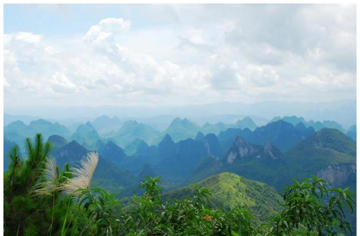
尧山 by 左岸红枫

桂林是一个很安全的城市，但是由于太多人做旅游，当你遇到一些特别热情地跟你介绍各种景点的拉客的人，你就要注意啦，尽量避免不愉快的旅程发生。桂林火车站和汽车站的扒手比较多，一定要注意保管好自己的随身物品。在一些网站上搜到的旅游信息也不可轻易相信，谨防“旅游枪手”。