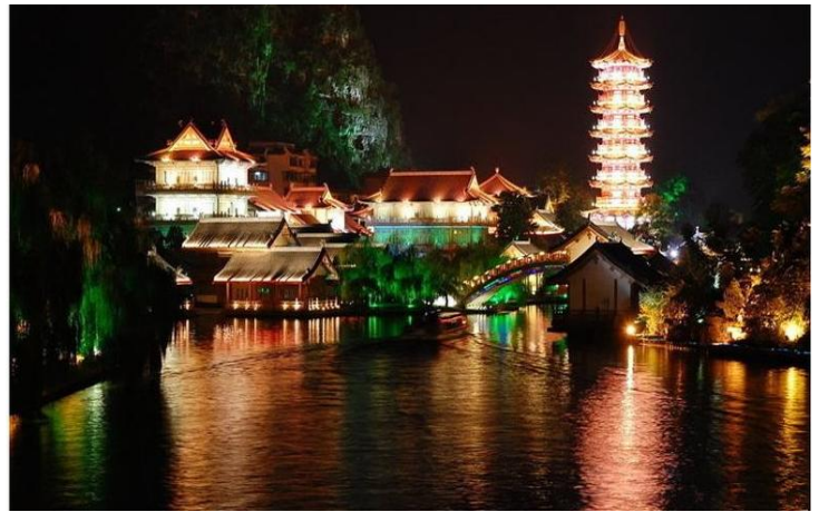
木龙湖夜景

两江四湖的夜景虽说是人造的，但也不失为晚饭后散步的绝佳选择。在华灯初上之时漫步其中，去感受桂林人的闲适生活。