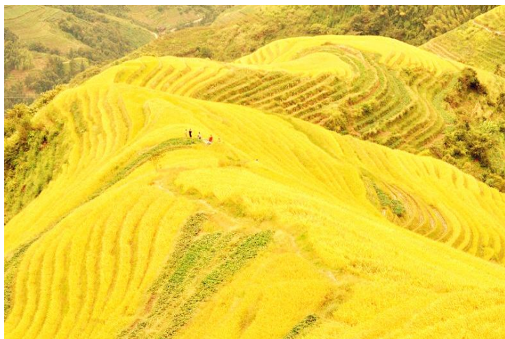
丰收的季节 by 6529416

民族风情： 龙胜各族自治县居住着苗、瑶、侗、壮等少数民族，少数民族人口占全县总人口的76%，有一句话叫“无山不瑶，无林不苗，无侗不侗，无水不壮”生动地说明了龙胜少数民族的基本分布情况。