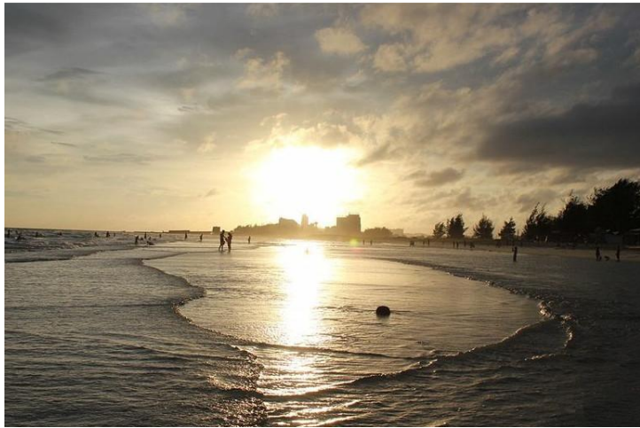
北海银滩

在古代北海是“海上丝绸之路”始发港，是中国西部地区唯一的沿海开放城市，也是中国西部唯一具备空港、海港、高速公路和铁路的城市，当然她也是旅游休闲度假好去处。