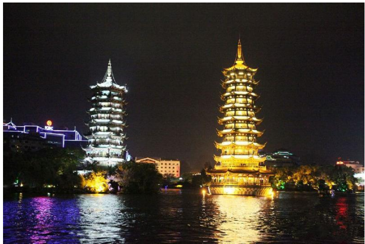
日月双塔 by Bluephantoms

解放桥六匹马码头位于解放桥东南端桥底，该处有六匹铜马为标识，乘11、31、10、14、18路公交车可抵达。