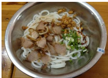
桂林米粉 by 艾雪儿1014

游客喜欢： 石记米粉店(解放西路微笑堂侧门对面街) 本地人气： 崇善米粉店(连锁) 又益轩粉店(解放西路，这里可以吃到马肉米粉) 刘伯娘粉店(连锁)