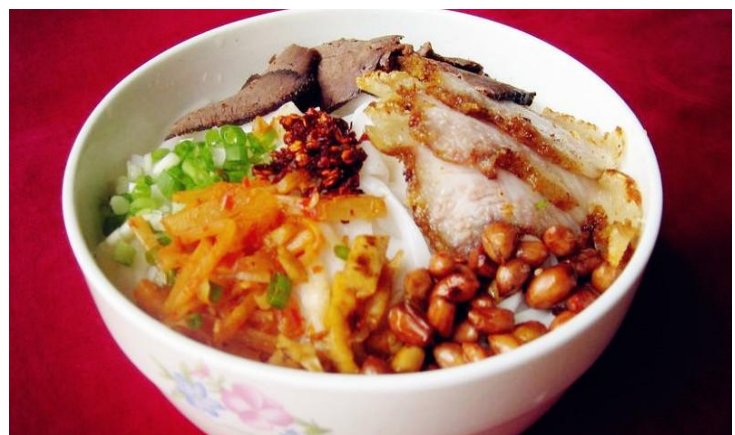
桂林米粉 by YM囡囡白羊

桂林米粉是桂林人早餐的不二之选，说是“倾城之恋”一点都不为过。正宗的桂林米粉只有在桂林当地才能吃到，所以一定不能错过。