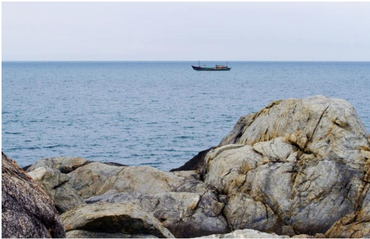
海边 by Yoto_121