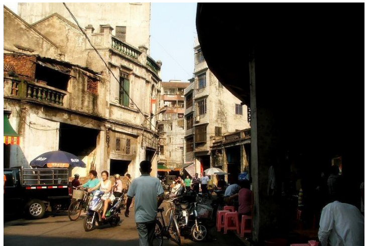
骑楼 by Yoto_121

街边小店销售家电、小商品、服装、鲜花、礼品等，生活气息浓郁。贯穿博爱路的是东、西门市场。东门为海鲜干货市场，西门则是古玩一条街，大大小小古玩摊档沿街而摆。