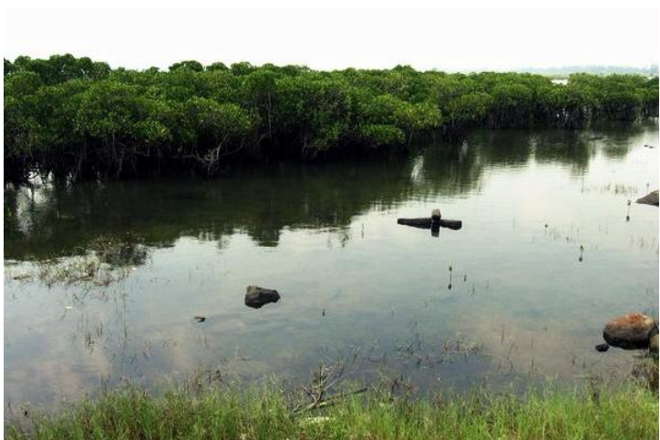
八门湾红树林 By wk2219