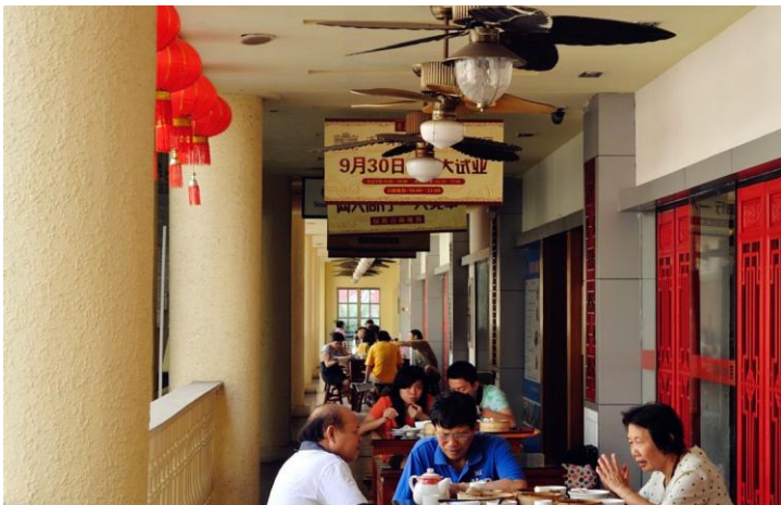
慢生活 by reton3

睡个懒觉，起床后慢悠悠晃去吃个早午茶，晚上可以只是单纯和朋友聊天或K歌，晚餐、夜宵，体验一天的海口生活。