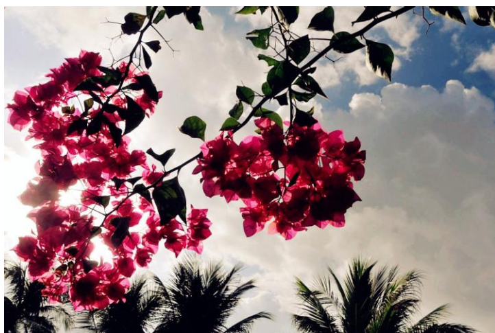
盛开的三角梅 by reton3