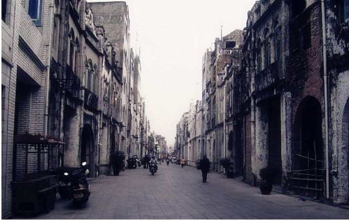
骑楼老街

叮叮咣咣的自行车骑过年成已久的街区，人们安逸地经过这里，历史像是骑楼老街里某一处不经意的花朵，不显眼但是很惊艳。