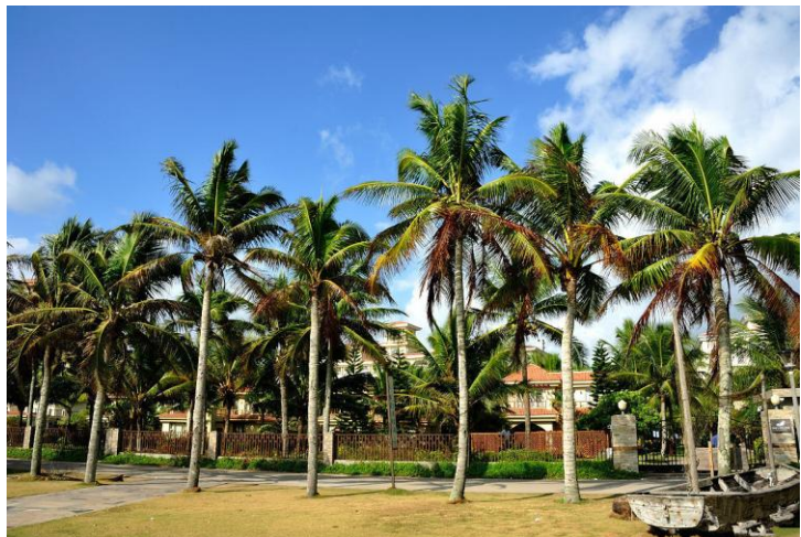
南国风光 by reton3