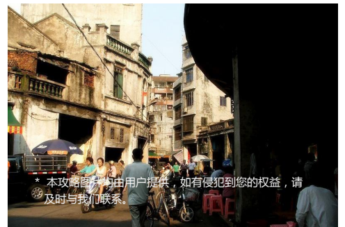
* 本攻略图片均由用户提供，如有侵犯到您的权益，请及时与我们联系。