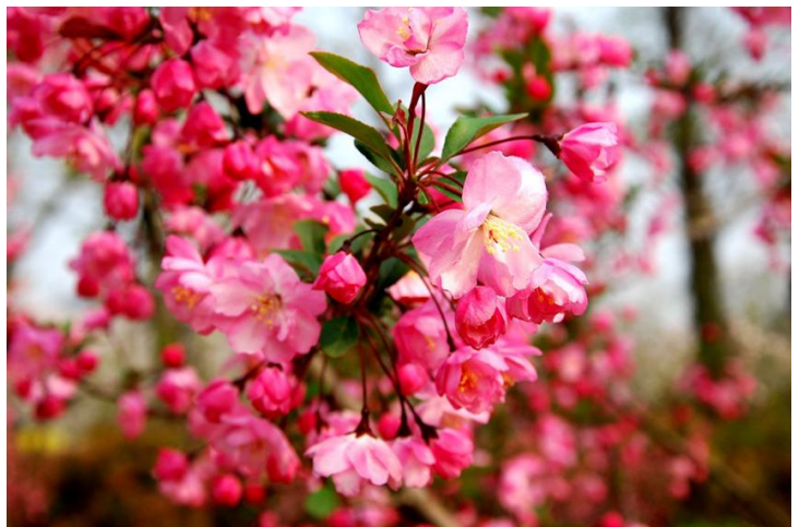
鼋头渚赏花 by 安咯破

第二天睡到自然醒，可以乘公交前往崇安寺步行街，吃地道的无锡早餐——小笼或馄饨，简单逛逛，顺便解决了午餐。午后前往锡惠公园，公交约半小时。深度游览后可以出景区顺便去一下惠山古镇，街上的点心不错，而后结束愉快的旅程。