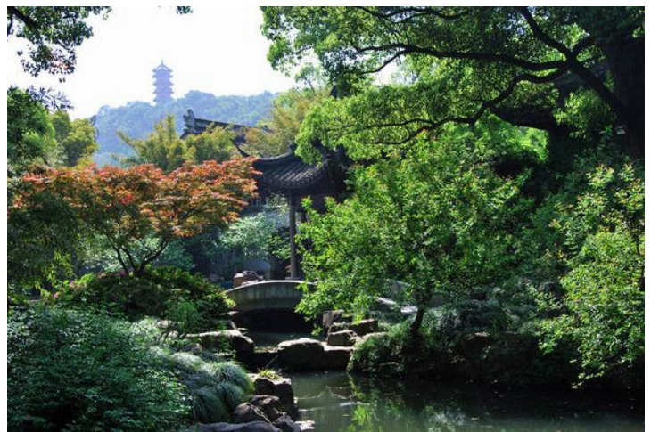
锡惠公园