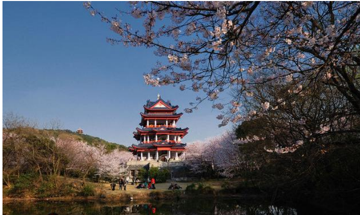
鼋头渚赏樱

鼋头渚浑然天成的秀美景色是太湖的精华所在。春游太湖，可不能错过了鼋头渚那漫天飞舞的樱花。