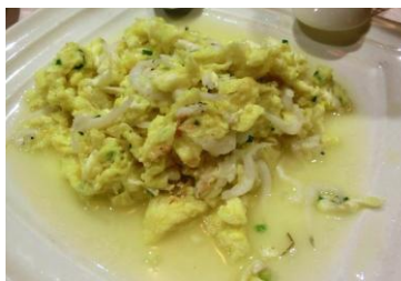
银鱼炒蛋 by 公说公有理

银鱼是太湖特产，肉嫩无骨，味道鲜美。银鱼可以炒蛋，也可以油炸，如脆皮银鱼就是把银鱼通条拖上调好味的面糊，下六成热的油锅中慢炸而成，外皮香脆，鱼肉鲜嫩。