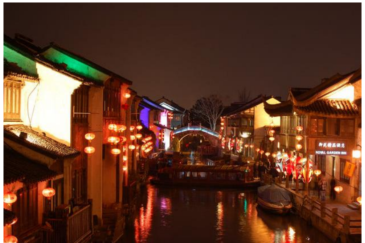
山塘街 by soccer1001