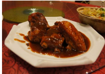
酱排骨 by 猥亵正义

鲜嫩的排骨浇上用老汤炖制的卤汁做成的酱排骨，滋味醇厚，骨酥肉烂，油而不腻，鲜美可口。