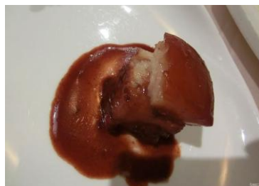
聚丰园腐乳肉 by 公说公有理

鲜嫩的五花肉做法各异，味道大不同。腐乳肉如其名主要调味为豆腐乳，喜欢豆腐乳的朋友们一定不能错过这道菜。