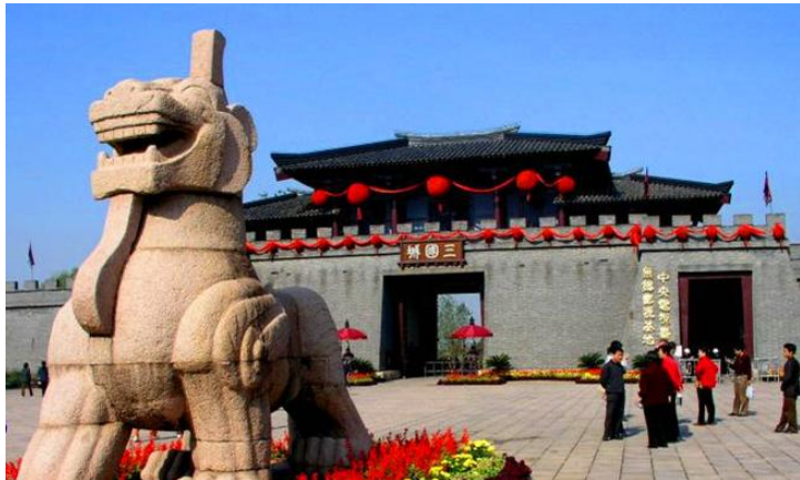
三国城 by 宠爱之名VIVI

三国城、水浒城气势恢宏，古朴凝重，以其独特的风格和魅力，吸引了海内外游人和影视摄制组前来游览和拍摄。