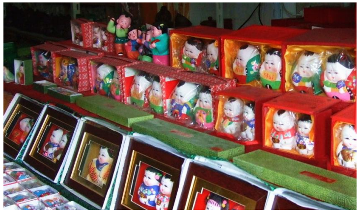
惠山泥人 by 经典洛宁

惠山泥人历时500多年，艺人们大多有着祖辈相传的手艺。泥人是极好的装饰品，憨态可掬色泽艳丽。