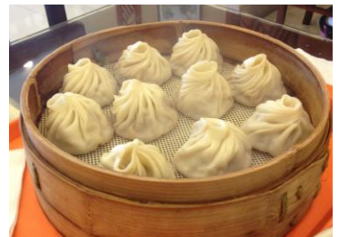
无锡小笼

无锡小笼在制作的时候特别讲究，肉糜在搅打过程中要分次适量加水，让肉糜慢慢吃入水份。这样做出的无锡小笼多汁味美，肉质松软不干硬，口感嫩嫩的。