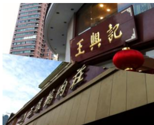
三凤桥、王兴记牌匾 by tunxiwan

大名鼎鼎的“无锡老字号”。酱排骨很受欢迎，色泽酱红、香味浓郁、骨酥肉烂，虽然15元/客一人份有点小贵。虎皮凤爪、熏鱼、梅汁翅中都是特色菜，可以一试。如果没有时间坐下来用餐，外卖窗口同样有许多熟食提供，带回家给家人朋友尝尝也不错。生意一直火爆，请做好排队等候的准备哦。