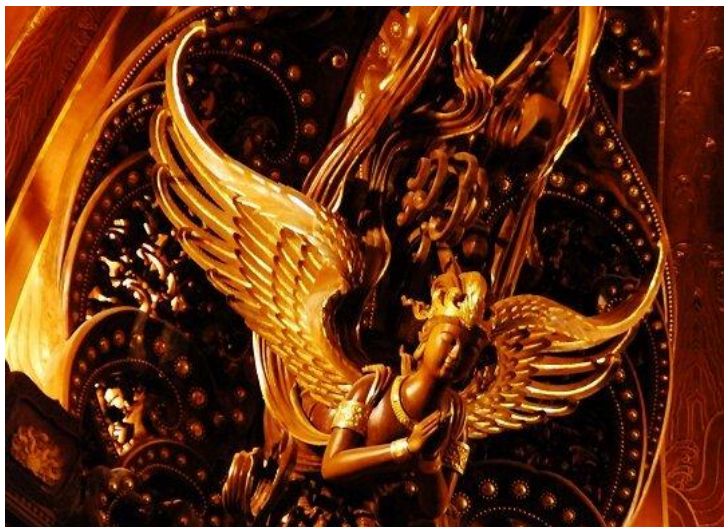
梵宫一角 by qian_0_wei