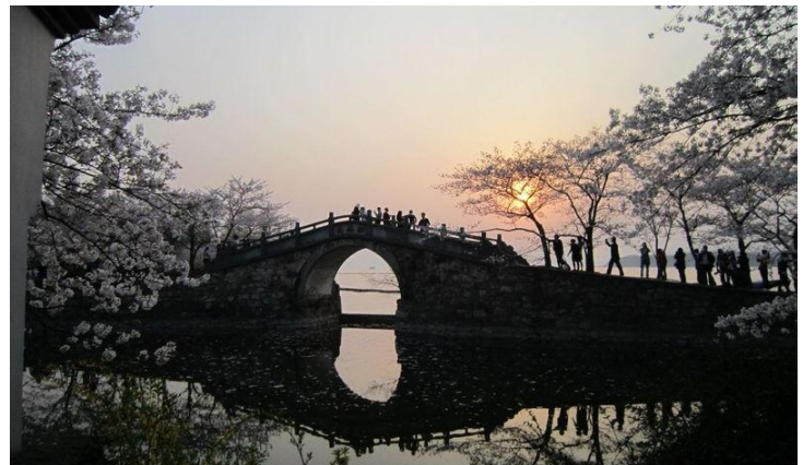
桥头赏樱

一天约20班, 运营时间7:20-19:00, 票价49-54元, 车程约2小时。