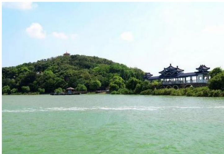
鼋头渚 by woohyuk_tian27

TIPS 鼋头渚很大，所以一定玩得要有规划。无论你从充山大门还是棧山大门进景区，最好都先去码头乘船到太湖仙岛。返航后，可以就近在南部景区玩，如果时间允许，可以回返到北部景区景区玩。要想玩得很透，最起码得花一天时间。