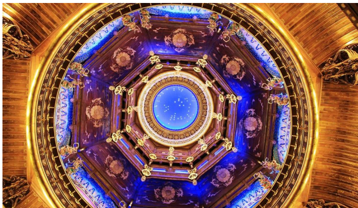
内馆 by 天亮了7979

这里有中国最华丽梵宫，以佛经故事为蓝本的九龙灌浴喷泉……灵山胜境等你来访，如来如愿，平安吉祥。