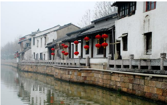
惠山古镇