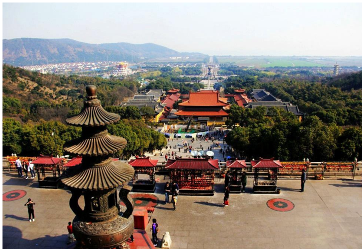
灵山胜境远眺