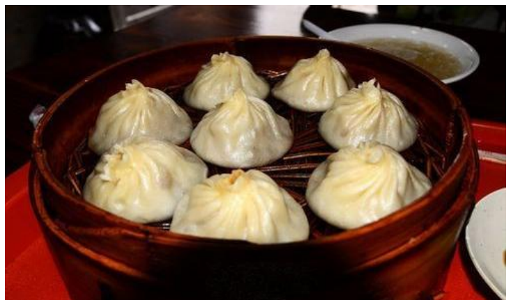
无锡小笼 by woohyuk_tian27

吃完蟹粉小笼，再来份无锡排骨，配上清清爽爽的拌芥菜，外加餐后水果——水蜜桃，幸福甜蜜就是这么简单（真心甜，一尝便知）！