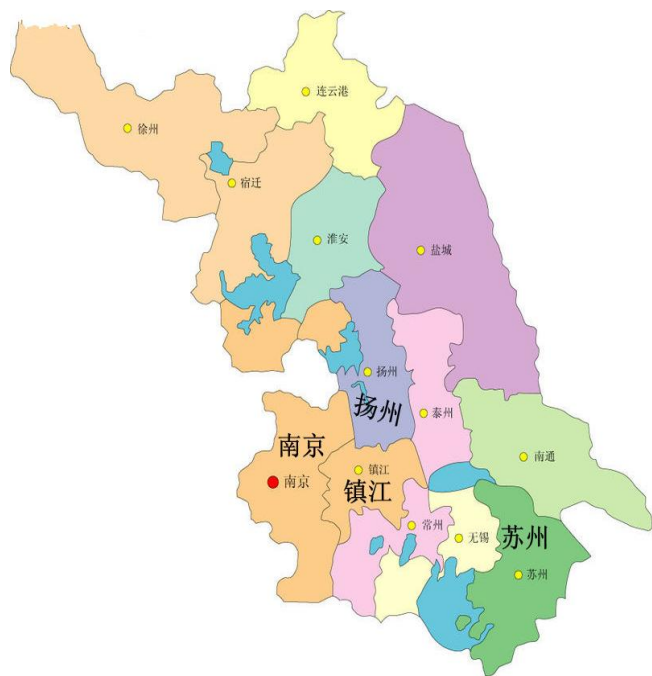
镇江周边城市区域图