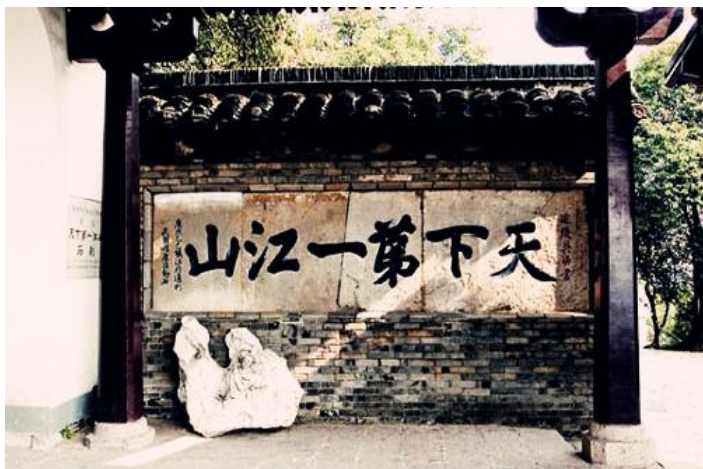
天下第一江山 by fly小庆超