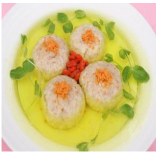
美味狮子头 by 慧慧爱土木

清炖蟹肉狮子头又称斩肉，镇江传统名菜。主料蟹肉和猪肉，斩切做肉丸，因烹调时不用酱酒着色，故称清炖，又因造型大而圆，夸张比喻为狮子头。此菜用砂锅炖制，趁热上桌，汤菜叶覆盖，揭去菜叶，就可见只只肉圆。