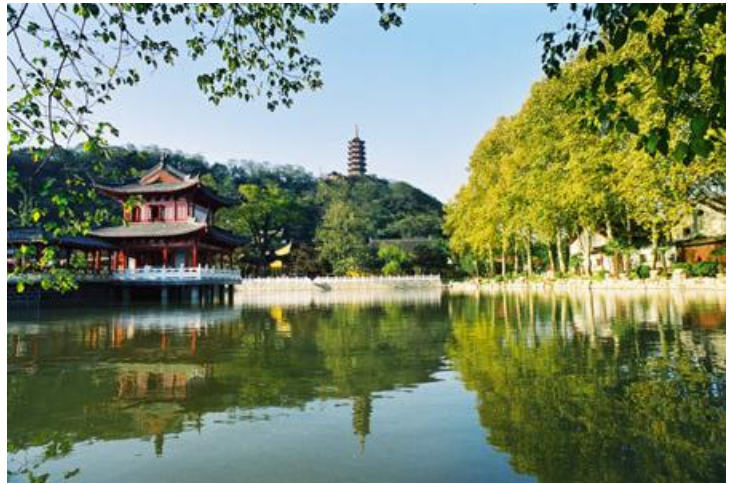
江山如画 by fly小庆超

TIPS 游览北固山，建议游客提前规划好路线，推荐路线为：清晖亭—北固山铁塔—“天下第一江山”石刻—“南徐净域”题额—甘露寺—遥马涧—狼石—多景楼—凌云亭—太史公墓—试剑石。