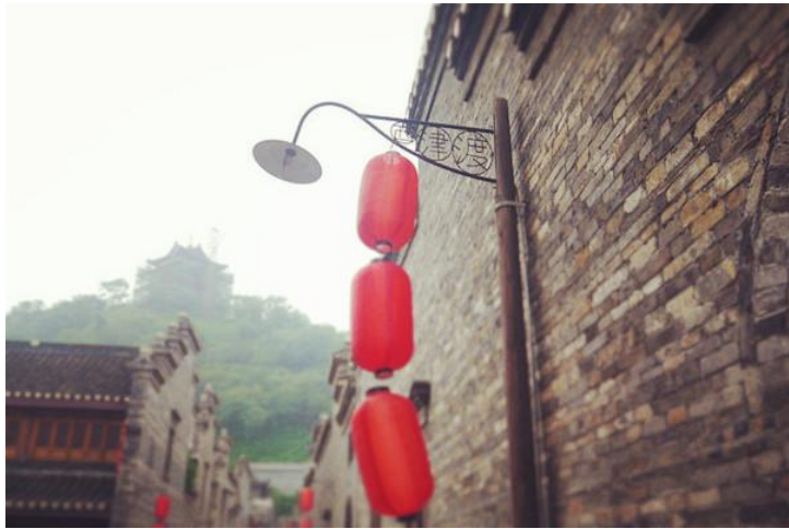
沿街小景 by rucer214