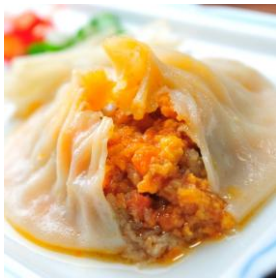
蟹黄汤包

镇江蟹黄汤包俗称蟹包，镇江传统名点，有二百多年历史，不但在沪宁线上素负盛名，而且驰名中外。汤包以蟹油、猪肉为主料，精心加工制成。体积小而外型美，具有皮薄、汤多、馅足、味鲜的特点，食时佐以镇江香醋与姜丝，不但口味更美，且能去寒解腻。