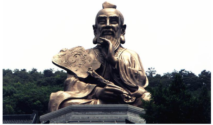
老子神像 by lamifuding