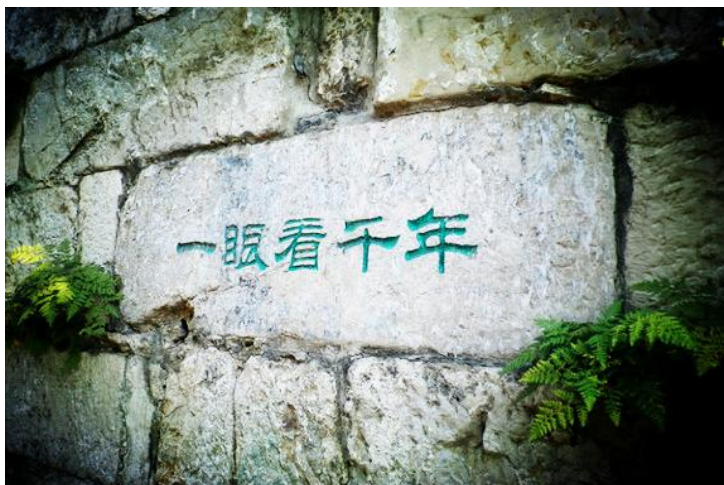
一眼千年 by rucer214

镇江同时是一座底蕴深厚、人文荟萃的历史文化名城，拥有3000多年文字记载的悠久历史，是吴文化的重要发祥地。不仅是“甘露寺刘备招亲”，“白娘子水漫金山”等传说的发源地，也是《文心雕龙》、《昭明文选》、《梦溪笔谈》等巨著的诞生地。“何处望神州，满眼风光北固楼”，“洛阳亲友如相问，一片冰心在玉壶”，“我劝天公重抖擞，不拘一格降人才”，历代文人墨客在镇江留下的名篇佳句，千百年来一直为人们传诵。