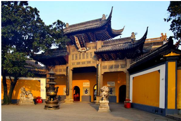
法门庄严 by 冀庄老二肚老大

交通： 镇江市内乘坐2、8、17、34、35、102、104、115路公交车均可到达。