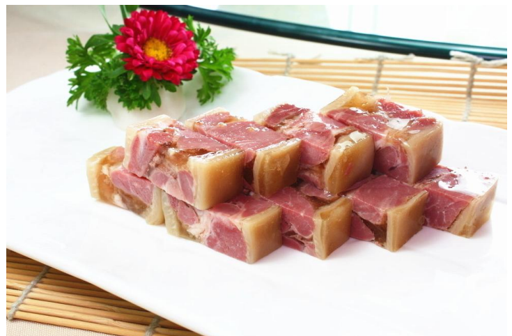
水晶肴肉

旅行之中当然少不了美食的陪伴，色泽晶莹、香嫩不腻的肴肉就是镇江特色美食的代表，广大吃货千万不要错过！