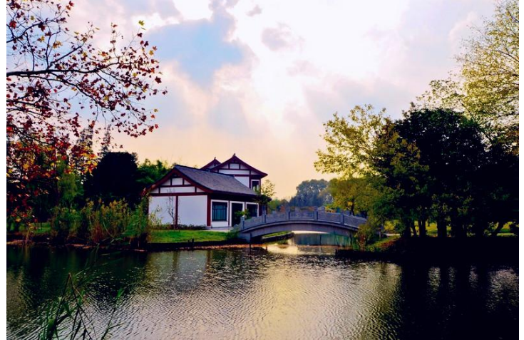
焦山秋景 by 冀庄老二肚老大