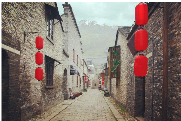
西津古渡