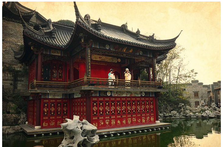
古渡戏台