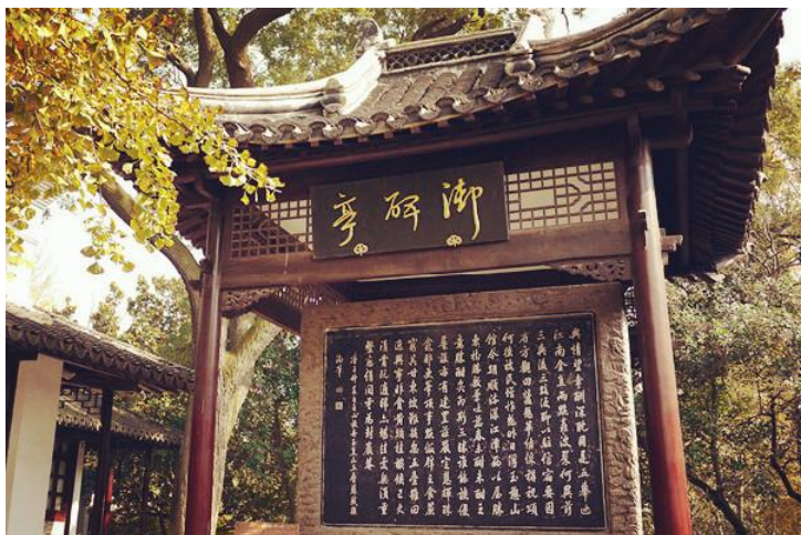
焦山石刻 by seag