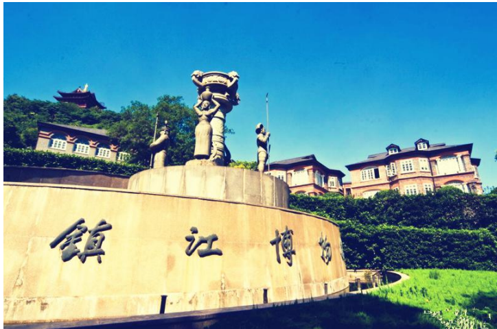
花园式博物馆