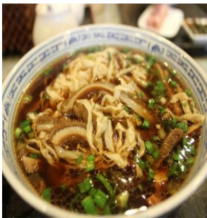
红汤锅盖面 by lilyYT

所谓的锅盖面就是将一只小锅盖摺在锅里，让它漂在水上，汤溢不出来，又透气，下的面条就是好吃的锅盖面。传说古时候镇江有户人家，妻子为丈夫下面条，一不小心将锅灶上的汤罐盖滑入面锅里。哪晓得这样下出来的面条比往常好吃，不硬不烂，软熟相当。由于面锅里放锅盖，人们即称“锅盖面”。