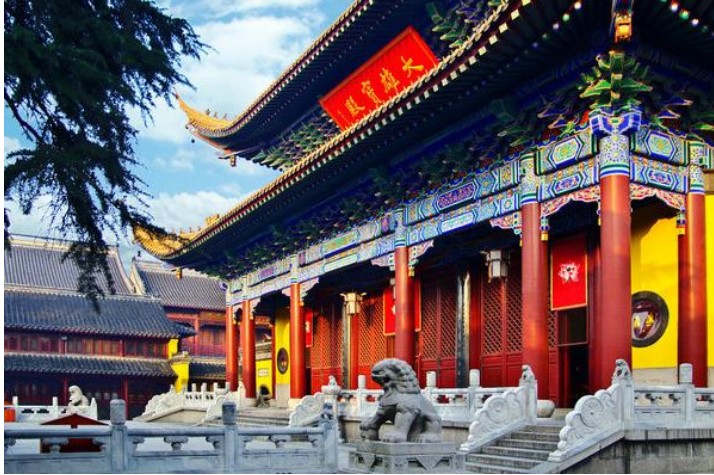
金山寺 by rucer214