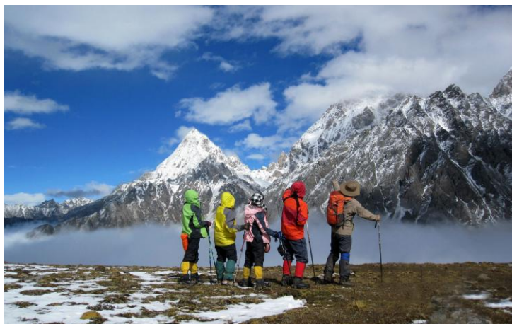
凹造型 by 宿苏Suzy

那一天，我们在贡嘎寺修整，一份普通的炒土豆被我们惊为天下美食，竟然吃了整整一锅米饭；那一天，我们阴差阳错，走到下子梅村，却意外的包到了两辆摩托车，直接到了子梅垭口；那一天，我们在子梅垭口露营，看到了漫天的星空，忍不住在凛冽的寒风中一起拍摄最美的银河。 ——《贡嘎山的极限穿越，遗落在人间的天堂》