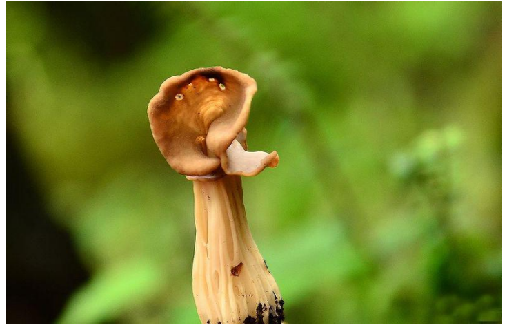
跑马山的野生菌