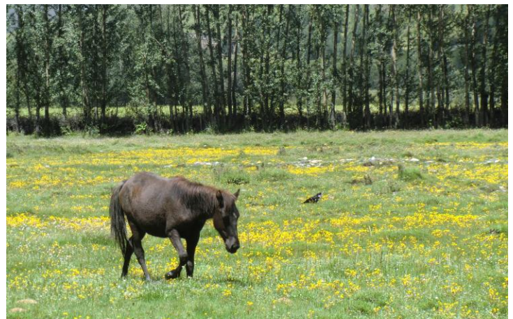
新都桥 by 林启万