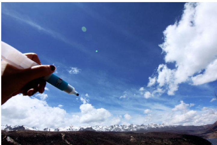
画一朵云