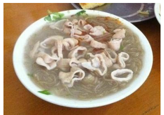
康定肥肠粉 by 家驹

正宗的肥肠粉选用的是上等红薯粉、菜子油及干红辣椒、花椒等原料，锅汤则是用肥肠、猪骨头等以及多种佐料熬制而成。红油飘香，霉干菜、榨菜末星星点点，炒黄豆焦黄浑圆。粉条糯软，满口留香。夹起颤巍巍的肥肠送入口中，只觉齿香细腻，清爽耐嚼。