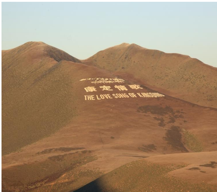
康定情歌 by 彼岸Claire