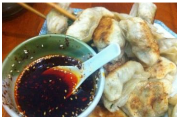
锅贴 by 家驹

汉族传统小吃，锅贴是一种煎烙的馅类小食品，制作精巧，味道精美，多以猪肉馅为常品，根据季节配以不同鲜蔬菜。锅贴的形状各地不同，一般是饺子形状。但是，在康定这个多民族聚集地，你可以吃到不一样的锅贴，味道很赞！