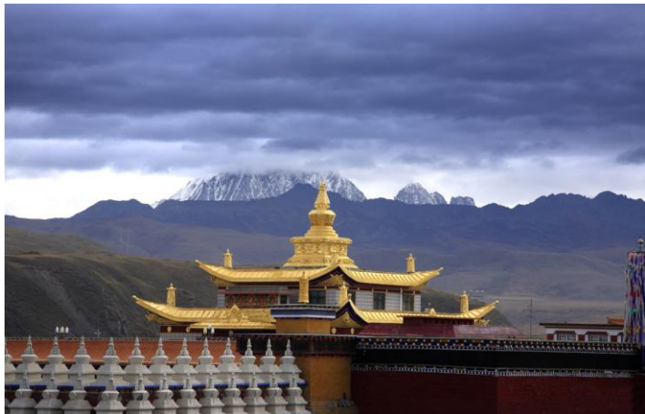
塔公 by 彼岸Claire