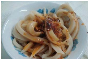
康定凉粉 by 好吃嘴