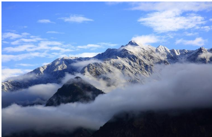
神山 by 彼岸Claire