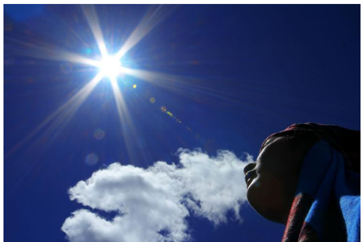
天堂梦在天堂口