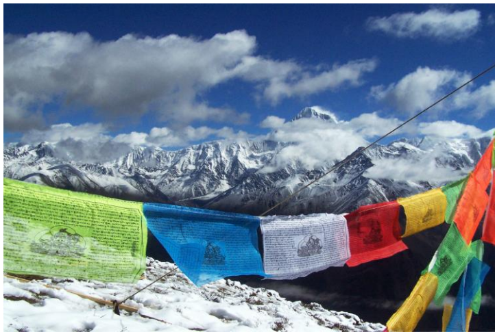
贡嘎雪山 by 宿苏Suzy