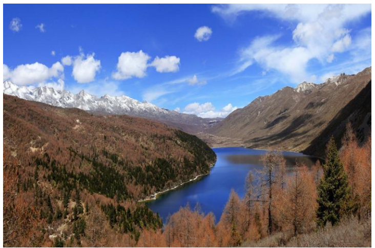
木格措全貌