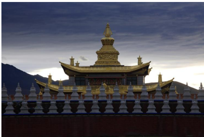
塔公 by 彼岸Claire

每当夏秋之季，塔公草原风光如画，在茵茵草地上，种类繁多的野花竞相绽放，绚丽多彩。当游客徜徉于花海之中，顿感飘飘欲仙。在晨曦初露的早晨，散落在草原上的牧民的黑帐篷里炊烟袅袅，时时飘来阵阵奶香、茶香。早牧的牧民挤完牛奶后，赶着牛群走向草原的深处，时面传来阵阵吆喝声和悠扬婉转的牧歌，给大自然平添了无限生机。在花团锦簇的草地上支起帐篷，或是到牧民家中做客，去了解牧区生活，感受高原的魅力，定会给游客一种难于言表的满足。