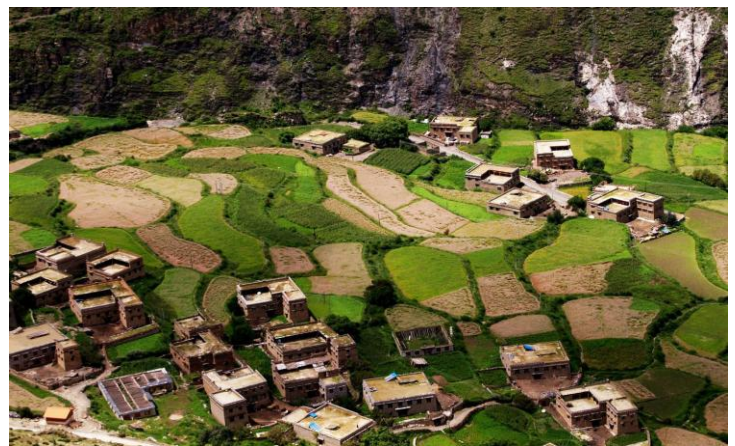
村落 by 颀圮的华年