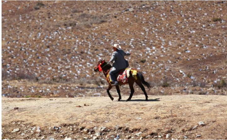
康定草原上