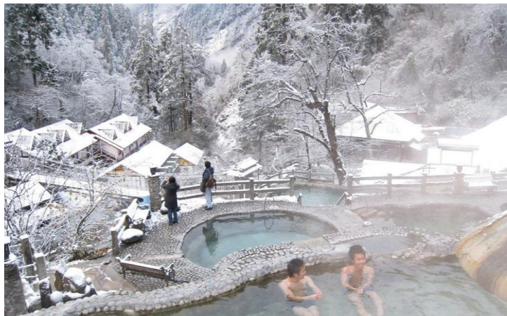
冬日温泉 by 度小游