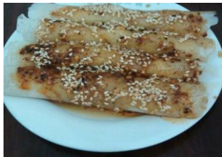
春卷 by 家驹