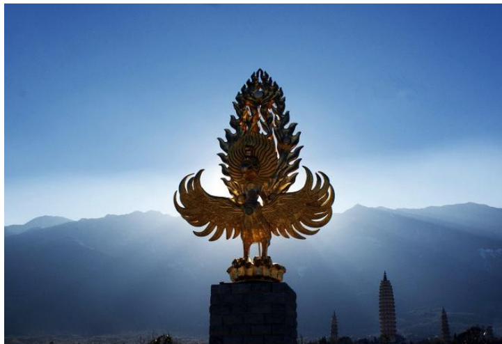
圣光映三塔 by punishlee

崇圣寺三塔，背靠苍山，面临洱海，三塔由一大二小三座佛塔组成，呈鼎立之态，是苍洱胜景之一。三塔也是云南古代历史文化的象征，历经千年时光的洗礼。