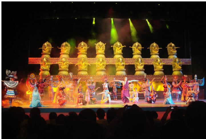
勐巴娜拉西歌舞秀 by 老长征

晚上可以到景洪市内的曼听公园参加篝火晚会，欣赏西双版纳最原始的民族风情，感受到少数民族生活、文化气息。先欣赏少数民族歌舞表演，如傣族王室宫廷舞、优美的葫芦丝演奏，瑶族独特的咬手定情婚俗互动节目等等。看完表演后可以参加篝火晚会，和少数民族同胞一起齐舞High歌。