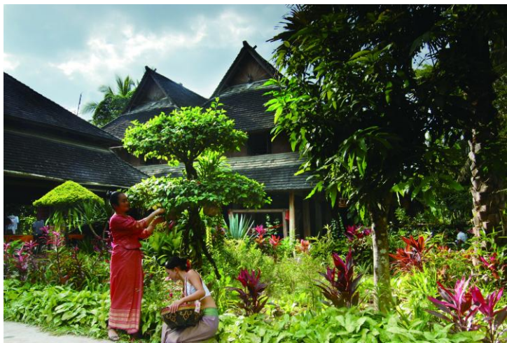
傣家庭院