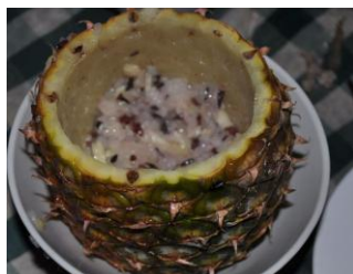
菠萝饭 by 其实没那么远

菠萝紫米饭看起来就很诱人，整个菠萝很萌的样子。首先要将紫糯米浸泡7-8个小时，将菠萝顶端切一个盖，掏去菠萝心，放入紫糯米，盖上菠萝盖后放到蒸锅里煮，闻到香味后，即可开盖食用。味道有点甜，而且有补血润肺的功效哦。