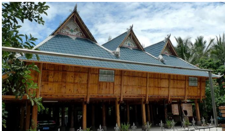
傣族园吊脚楼

傣族村寨到处可见的吊脚楼，好几代傣族人都住在一个吊脚楼里。据说吊脚楼是不怕地震的，越震越稳固，另外还有防雨防潮的功能，有机会一定要住住无敌吊脚楼。