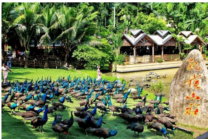
孔雀山庄 by 米恩karine

西双版纳原始森林公园的孔雀山庄，有成群的孔雀在小湖边的草坪上晒太阳。养孔雀的傣家女子提着篮子准备喂食，哨声一响，孔雀们从四面八方飞来，密集恐惧症的人们要颤抖啦。