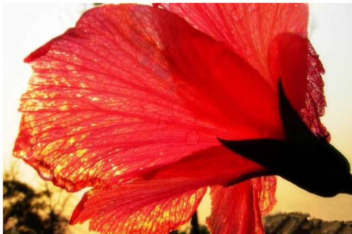
花里看世界 by 徐狮子