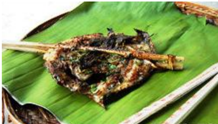
香茅草烤鱼 by 徐狮子

西双版纳的夜晚是属于傣味烧烤的，在夜晚的曼听小寨吃烧烤，或是在景洪市中心的沿街排档一坐，边闻着香茅草烤鱼的香气边观赏夜景，怎一个惬意了得。