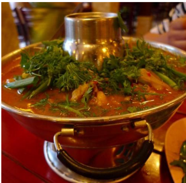
财春青银色小火锅 by 熊猫爱旅行