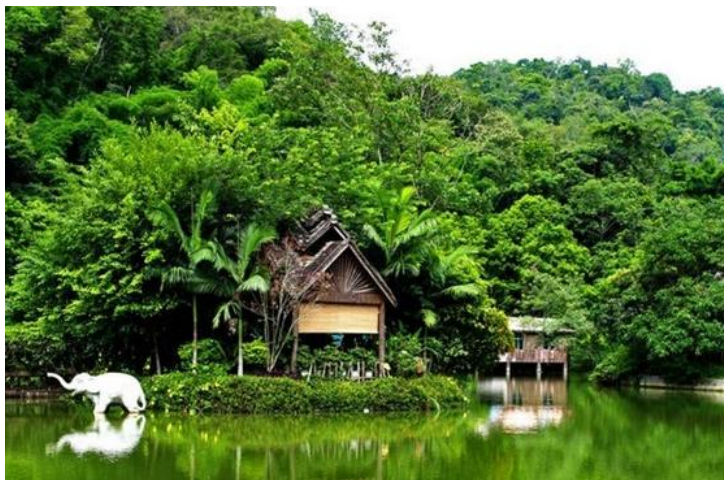
野象谷公园

午后继续前行至野象谷，看长臂猿、金刚鹦鹉、大象表演，这里是植物的世界，也是动物的天堂。运气好还能看到野象哦！