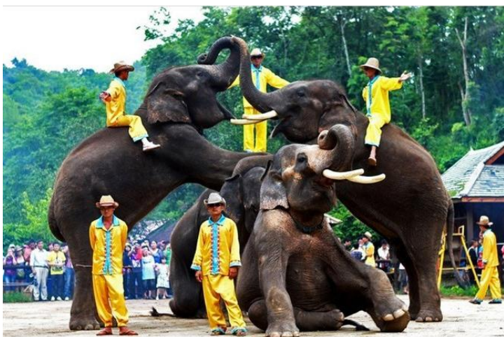
大象杂耍 by 米恩karine