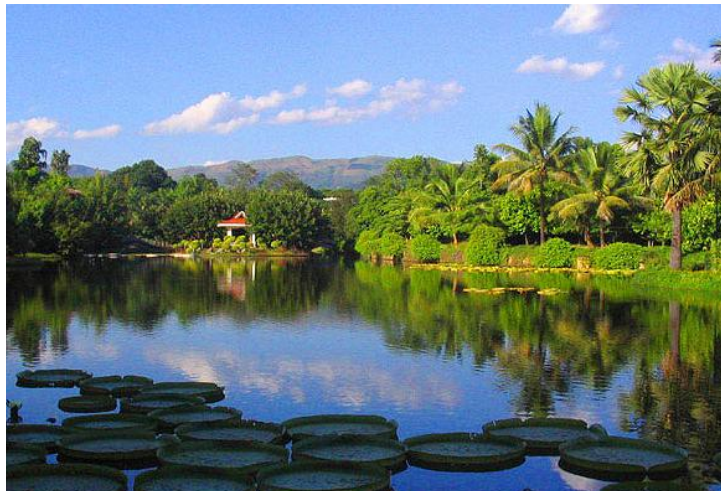
热带植物园 by Drally3