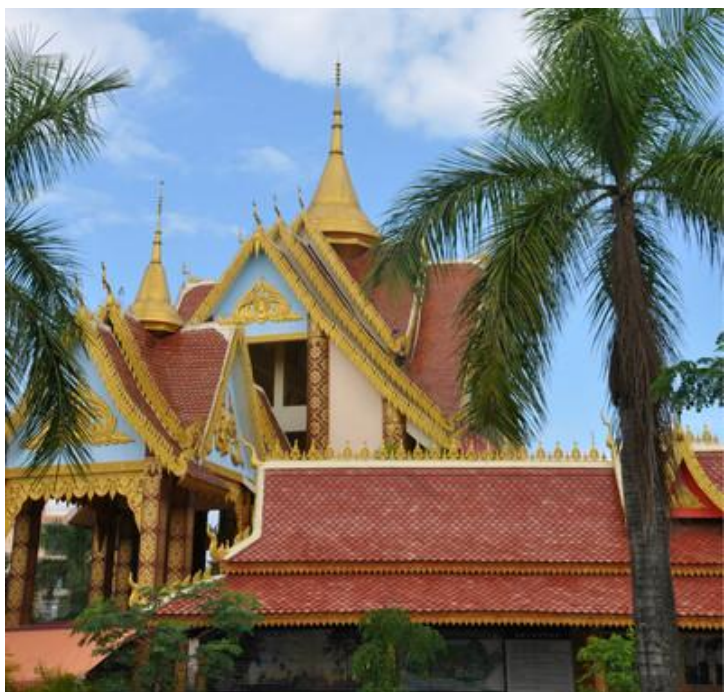
傣族园建筑