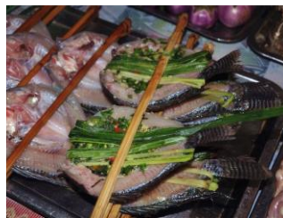
香茅草烤鱼 by 其实没那么远

香茅草烤鱼也是一道傣族风味菜。一般先将洗净的鱼裹上味道芬芳的香茅草，然后置于火上烧烤，并抹上适量的猪油，烤时香气四溢，这样烤出来的鱼香味扑鼻，鱼肉酥脆、味道鲜美独特。