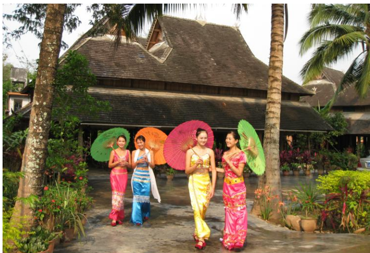
竹楼配傣妹