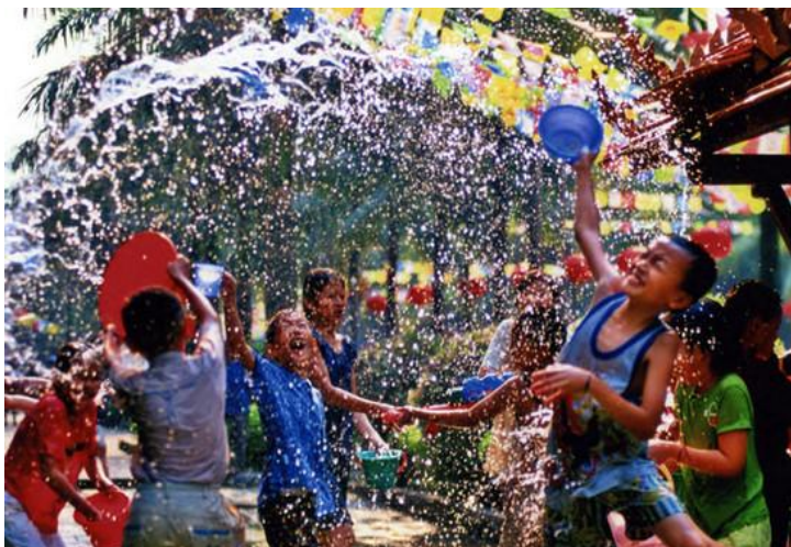
泼水节 by 红辣椒chili