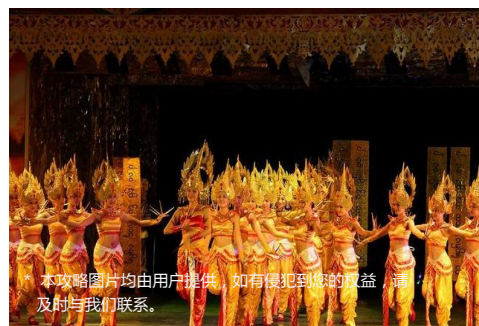
* 本攻略图片均由用户提供，如有侵犯到您的权益，请及时与我们联系。