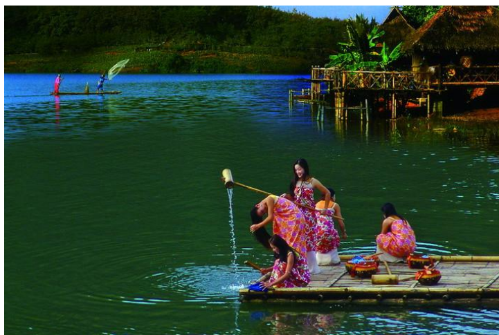
河边傣女梳洗

罗梭江漂流全长3.5公里，约需1.5-2小时，漂流的最佳季节是每年11月至次年5月旱季期间。在小小竹排上一坐，沿岸的风景都是你的了。沿岸有勐仑植物园、绿石林公园和傣族村寨、哈尼村落，形成了美丽的田园风光景色。