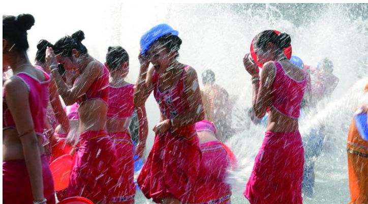
泼水活动

傣族园的下午会有热闹的泼水活动，也是看傣妹的最佳时间啦。即使没赶上真正的泼水节，也可以围观泼水活动过过瘾。