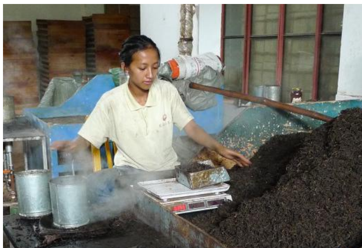
制茶工艺 by 熊猫爱旅行

西双版纳是中国最古老的茶叶发源地之一，著名的普洱茶六大茶山均在版纳境内。早在明清时期，普洱茶就是中国最古老的茶马古道上的重要商品，并经古道远销中亚及西亚地区。另外，版纳的大叶种茶加工出的红茶香气馥郁，绿茶汤色清绿。著名的茶叶品种有：南糯白毫、佛香茶、云海白毫、岗绿、旋云茶等。爱茶叶的不妨带一些茶叶走，建议在正规大型超市或专卖店购买。