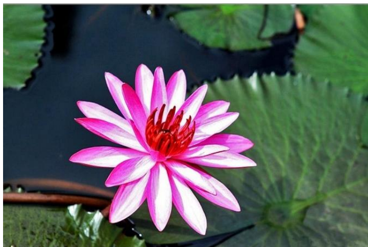
花开烂漫-热带植物园 by 米恩karine

上午从景洪市区出发到勐仑，沿途游览澜沧江风光，游览著名的“孔雀尾翎”橄榄坝，欣赏热带风光和傣家村寨，同时可以品尝各种热带水果。午餐时间到了，在镇上品尝正宗的傣味。午后从勐仑镇走过罗梭江吊桥（步行约10分钟）便可来到勐仑的热带植物园，观赏各种热带植物以及罗梭江风光。下午返回景洪，到曼听公园参加篝火晚会，观赏民族歌舞以及品尝风味餐，随后宿景洪市区或直接前往下一个目的地。