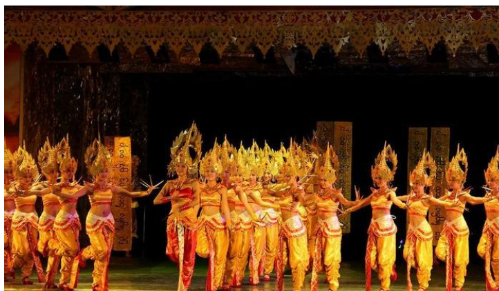
民族歌舞表演 by qnaq2004

夜晚的曼听公园，总有个把民俗风情的演出，“澜沧江之歌”傣族舞蹈《贝叶之光》、拉祜族《口弦舞》、瑶族《咬手定情》、哈尼族《抢亲》、老挝舞蹈《召树屯》……歌舞表演过后更有篝火晚会、放河灯等活动，精彩纷呈。