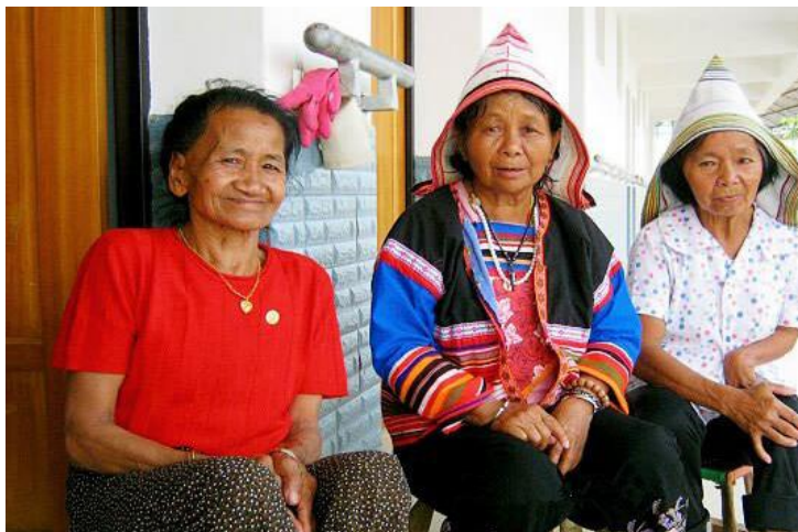
居民生活 by 易融

西双版纳为十二的意思，版纳即为十二个版纳：版纳景洪、版纳勐养、版纳勐龙、版纳勐旺、版纳勐海、版纳勐混、版纳勐阿、版纳勐遮、版纳西定、版纳勐腊、版纳勐捧、版纳易武。西双版纳是明代隆庆四年（1570年），宣慰司（当地最高的行政长官）把辖区分十二个“版纳”（傣语“十二”“西双版纳”是一千亩之意，即一个版纳，一个徵收赋役的单位）。从此便有了“西双版纳”这一傣语名称。