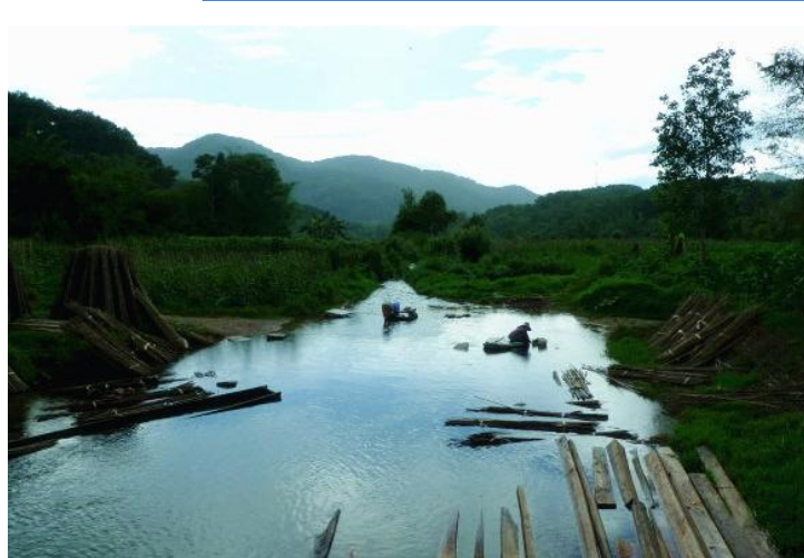
河边洗衣