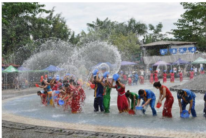
泼水活动