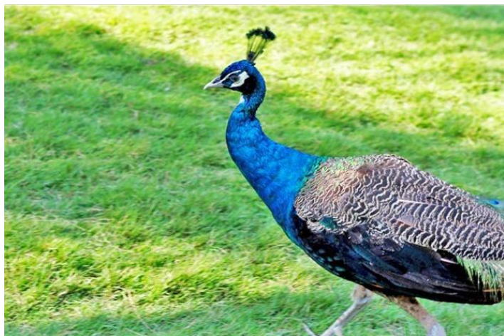
孔雀迎宾 by 米恩karine

交通：景洪市车站有到森林公园的公交，或市区打车，去程约35-45元，回程约25元