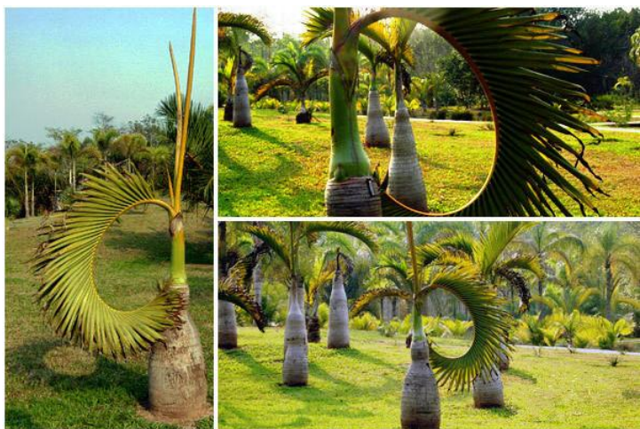
植物园酒瓶棕 by 徐狮子

交通： 在景洪客运站乘坐勐仑、勐腊方向的车，到勐仑下车，行程约1小时。如从昆明、思茅出发可乘坐开往勐腊方向的车到小勐仑镇下车。从小勐仑客运站步行到吊桥需10分钟，买票后过吊桥需20分钟才到景区