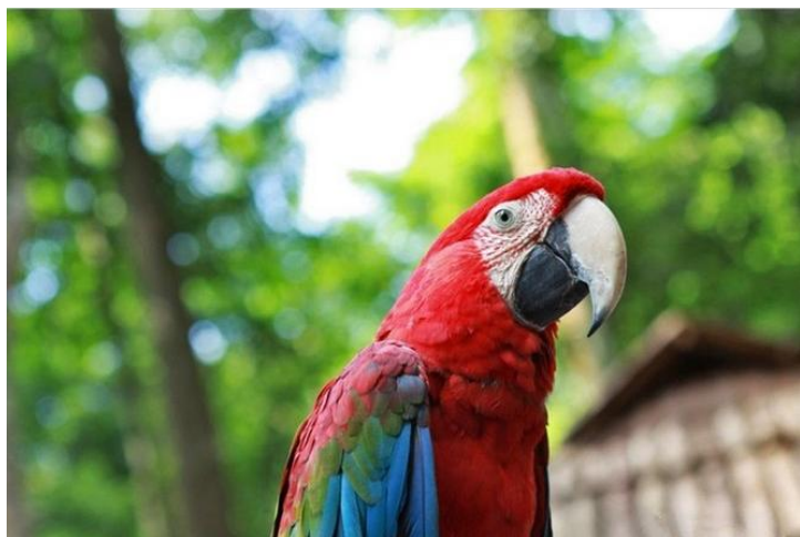
金刚鹦鹉 by 米恩karine