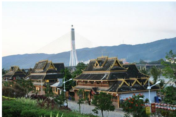
曼听公园

交通： 3路公交可直达，也可步行或乘人力车前往，从曼景兰风味街向前走300米左右即到