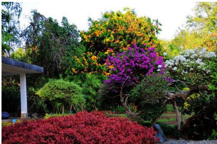
热带植物园-繁花似锦 by 徐狮子