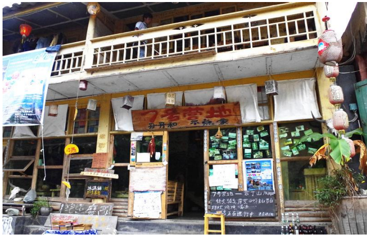
七号营地酒吧