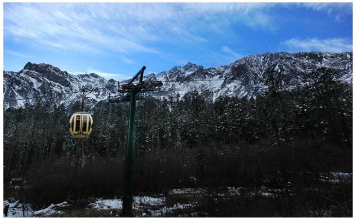
索道 by 叫我缪缪