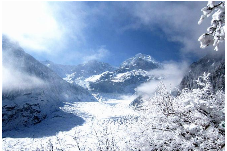
冰川 by i兔纸