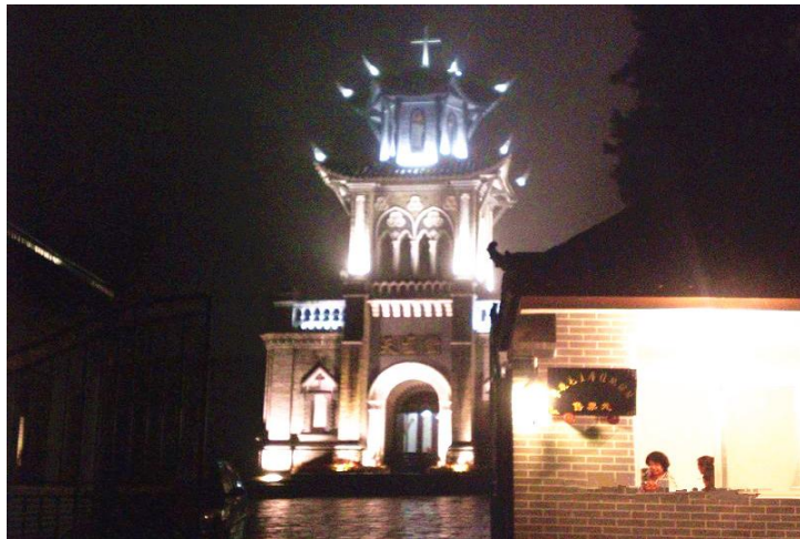
哥特式天主教堂

天主教堂位于磨西镇老街，始建于1918年，1935年5月红一方面军两万主力途经磨西飞夺泸定桥，毛泽东、朱德、周恩来、陈云等中央领导宿营磨西天主教堂，在神父楼召开了著名的磨西会议，毛主席住地旧址和磨西会议旧址保存完好。