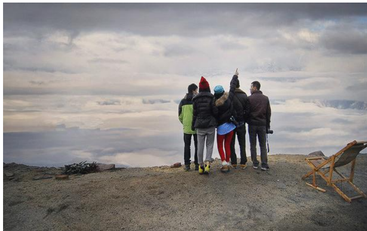
牛背山合影 by 叫我缪缪

牛背山位于四川省雅安市荥经县境内，与泸定县交界，属二郎山分支，是青衣江、大渡河的分水岭，山顶海拔3600米。本来就是一矿山，后来被发现可以看见众多川内知名山峰，因而名声大振。非旅游开发区，无供电，无热水，无植被，无客栈（只有“帐篷客栈”提供大通铺）；海拔3600米，早晚温差近20度，白天日照强烈，夜晚寒风凛冽天气多变。