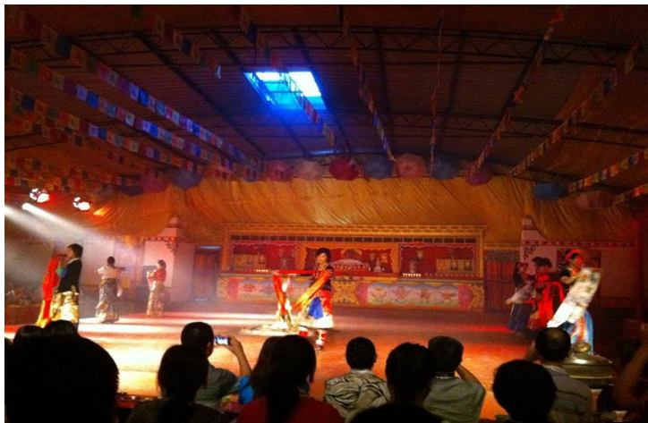
歌舞晚会 by 晞晨

晚会帐篷内点燃了汽灯、蜡烛和酥油灯，光芒透过帐篷，宛若无数颗星星在夜空中闪烁。在入场前工作人员都会给大家发一条哈达，还有烤羊与煮土豆，藏族同胞表演他们特有的歌曲与舞蹈，非常热情，现场氛围很热闹，领略藏族风情。