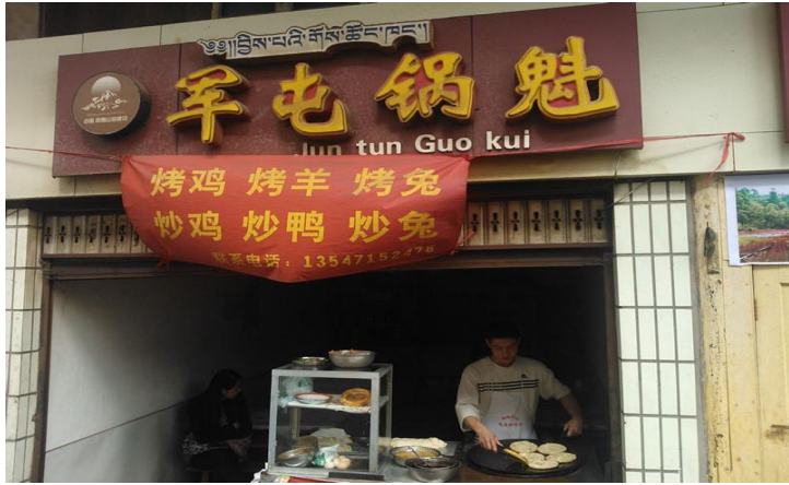
超级好吃的饼

磨西镇小吃店不多，所以这家在镇上也显得特别显眼，锅魁很能充饥，好吃不贵。往老街方向走就可以看见这家店。