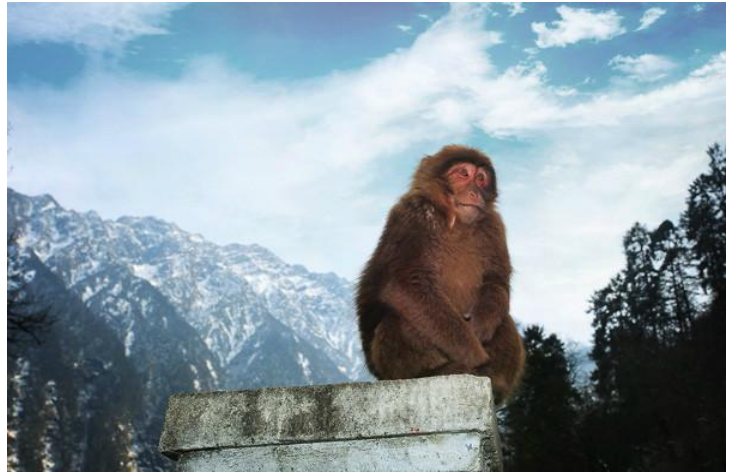
猴子 by 叫我缪缪

沿着环游山路徐徐前行，你的眼球会被身旁变幻无穷的植物所吸引，丛林之行，时常影约可见猕猴、松鼠、红腹角雉等可爱动物的身影。