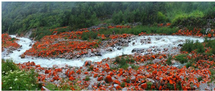
红石滩

从海螺沟去雅家埂车行在一个小时左右，它位于康定老榆林和海螺沟磨西镇之间，雅家埂河上游，是贡嘎山脚下又一颗光耀夺目的明珠，自古以来就承载着内地与藏区的联系纽带作用，雅家埂身上环绕着“唐蕃古道”与“茶马古道”的双重光环。从山下一路盘山公路上去，途经红石滩、雅家情海，最后到达雅家埂石碑、灰海子。所以去的话最好自驾或者包车，如果体力好的话可以骑车。值得一提的是雅家情海，据说六世达赖曾经去过，在那里作过许多情诗，如果时间不赶的话值得一看哦！