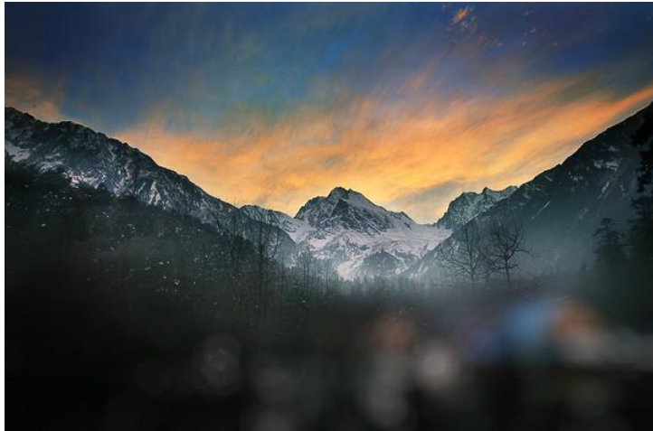
日照金山 by 叫我缪缪

每当天气晴朗，东方吐白，灿烂的霞光冉冉升起，一瞬间，数十座雪峰全披上一层金灿灿夺目的光芒，仿佛镀上了一层金边，瑰丽辉煌，这就是著名的“日照金山”。