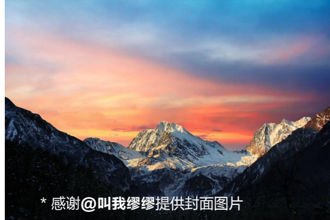
* 感谢@叫我繆繆提供封面图片