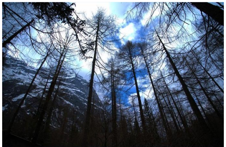
原始森林

森林里保存着很多原始生物物种，各种野生观赏植物争奇斗艳，将海螺沟装点成五彩缤纷的世界。同时海螺沟也是世界众多珍稀动物的栖息地，它们穿行于山谷和原始森林间，虽然其中不乏凶猛的狗熊和野猪，但只要人不主动伤害它们，它们是不会主动攻击人类的，绝大多数野生动物对人类已从生疏变得渐渐熟悉了，随着旅游者的增多和国家保护野生动物法令的实行，野生动物不再惧怕人类，但是在观赏时还是要注意安全。