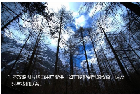
* 本攻略图片均由用户提供，如有侵犯到您的权益，请及时与我们联系。