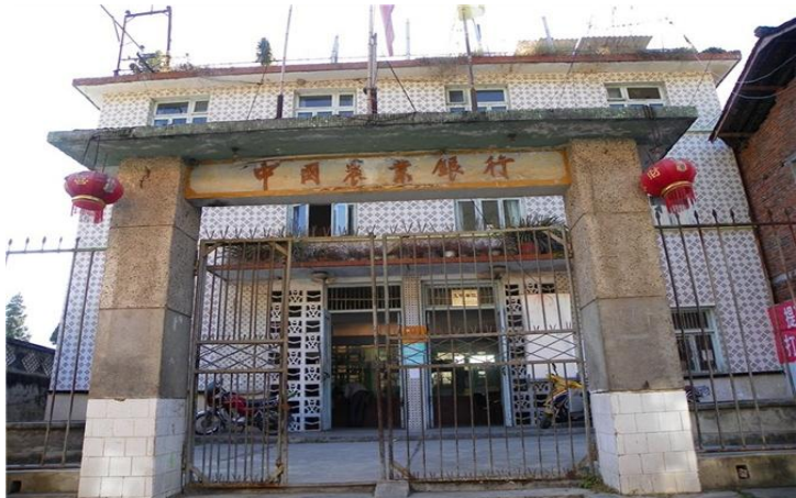
旧银行 by 今生唯爱多海

磨西镇只有一家农业银行，如果没有农业银行的卡，在这里取需要扣几块钱的手续费，按一百块扣一块手续费以此类推。