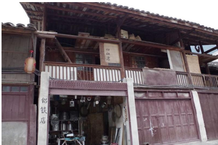
磨西老街 by YISSHUI

磨西镇在海螺沟沟口，是去海螺沟的必经之路，汽车也都停在这里，磨西镇历史悠久，尽管岁月沧桑，人们从它众多的明清古建筑中也能窥探出其久远的历史痕迹。旧有的中国式建筑依旧保存着那份凝重，而其中一座法国传教士修建的哥特式教堂，它所传出的礼拜祷告钟声已回响了一个世纪，中西文化的交融给古镇增添了另外一番情趣。这座教堂的名气来自于长征时毛泽东、周恩来、朱德等人曾在此住过一晚，并在此召开了磨西会议。