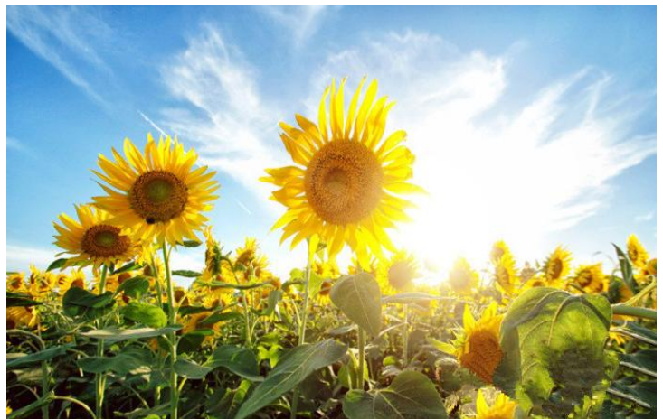
葵花节 by June1988lj

葵花节在每年7月19日至7月31日，四川很多地方都有向日葵田，可唯有海螺沟的向日葵花海是与雪山、蓝天、冰川、雄鹰相伴，加上特有的藏羌彝民俗风情，在海螺沟赏葵花一定让人非常难忘。