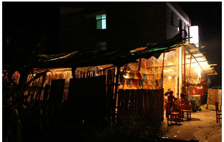
藏家晚会

多彩的服饰，不同的藏庄，动人的歌舞，浓郁的康巴藏族风情与这里的山山水水融合在一起。