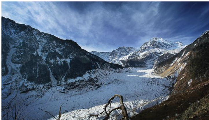
冰川全景 by 叫我缪缪

世界上大多数的冰川都位于海拔高处，然而在海螺沟海拔较低处就能望见冰川从高峻的峡谷铺泄而下，轻而易举接近千年不化的冰川。