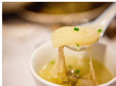
竹荪 by 风往东边吹