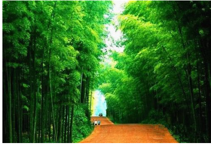
翡翠长廊 by 大写的S

走在翡翠长廊那茂林修竹间，脚踏红地毯般的红色砂石，耳边松涛阵阵，清新的空气中饱含竹叶的清香，如置身世外。继续拾阶而上，去寻找、饱览“人面竹”的风姿神采。