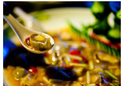
竹荪蛋 by 风往东边吹

竹荪蛋是这里的另外一大特色，是竹荪没有长出来之前的形态，模样就像一颗蛋，口感是脆脆的，外面还包裹着一层菌类的汁液，只有在蜀南竹海能吃到的特色。