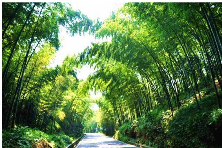
翡翠长廊

翡翠长廊，万竿拥绿，修篁伟岸。盛夏时节，长廊是一个清凉的世界。也正如一首赞美它的诗所说：“红霞铺垫，玉柱框廊；炎阳无炎，狂风不狂”。晴空万里之时，竹叶间漏下的缕缕阳光，在地上撒下点点金光，把长廊打扮成了一个色彩斑斓的世界。下雪之季，似锦铺地，绿枝琼花，别有情趣。游人至此，无不游憩、摄影留念。