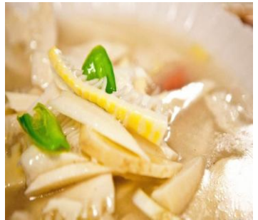
笋 by 风往东边吹

清爽的笋片加几点葱绿，十分养眼，将青笋斜切成均匀的拨片，均匀翻炒，清清淡淡，回归竹之本色。