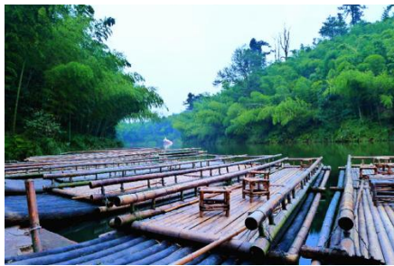
划竹筏 by binbinoooo00

当荡起竹桨任竹筏泛舟中海时，你会将尘寰喧嚣尽付流水而去，即使有满腹忧愁，也会变忧为乐。