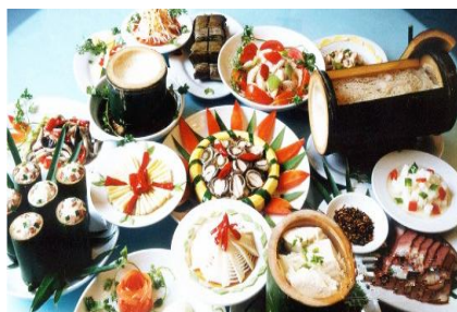
划竹筏 by 秋布衣

来到蜀南竹海，一定要尝尝“全竹宴”。每道菜都青青幽幽、自自然然，还没有下筷，就感觉好像到了绿林深处呼吸一样，舒服极了。