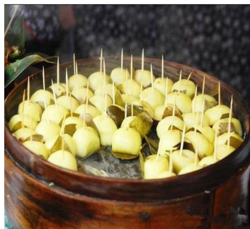
叶儿粑 by 秋布衣

叶儿粑又名鸭儿粑，宜宾人一般逢年过节餐桌上的一道美食。用绿色的良姜叶包裹着，晶莹剔透，白白胖胖，馅料鲜香，勾人味蕾，是许多宜宾游子童年记忆里那股幸福的味道。