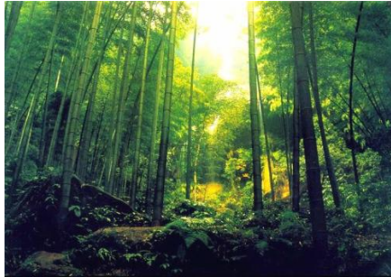
忘忧谷 by 大写的S

在幽深秀丽的忘忧谷，伴着流水潺潺，或一人独享夜空的静寂，独赏月光，或携家人漫步忘忧谷，在月光下聆听悠扬的竹乐。