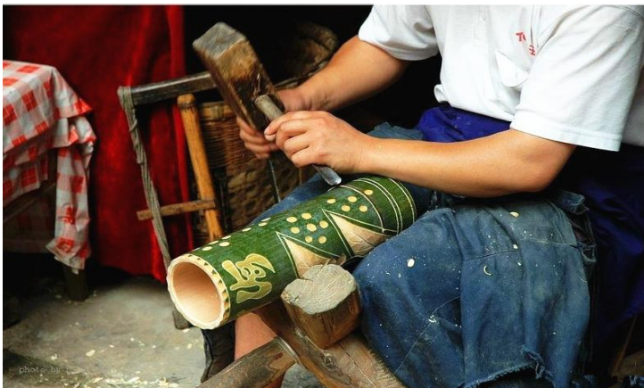
竹雕 by 蓝色冰B

蜀南竹海以竹著称，这里有很多巧手的民间艺术雕竹人，看他们制作的过程也不乏是种享受。