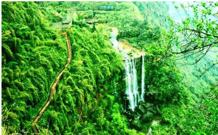
七彩飞瀑 by 镜子里熊

七彩飞瀑处在石鼓山和石锣山之间的葫芦谷中，从深林里流出的水潦河，在回龙桥下分为四级泻下悬崖，落差近200米，蔚为壮观。