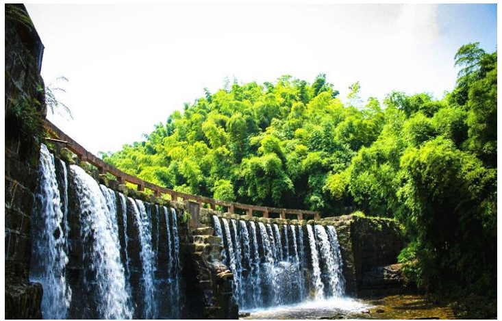
竹海 by errrrrr8