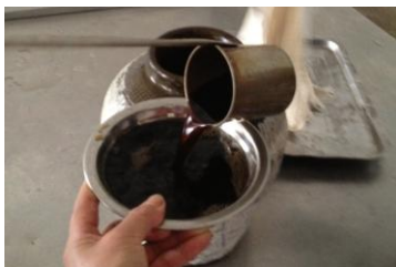
绍兴老酒 by asmcvc

绍兴当地人又称黄酒为老酒。来绍兴千万不能不尝绍兴老酒，越地酿酒历史可上溯到春秋时期。绍兴老酒采用传统独特工艺，以得天独厚之鉴湖水酿制，集饮料、药用和调味于一身，为中国黄酒之冠。其中的古越龙山牌加饭酒和绍兴花雕坛酒最为著名。