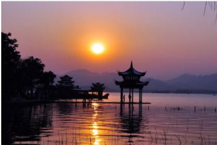
暮色杭州 by 酥死晨

享有“人间天堂”美誉的杭州，在西湖烟雨、龙井茶香中将温婉的江南展现在你面前。西湖如同一位魔术师，无论春夏秋冬、阴晴雨雪，都能幻化出绝美的姿容。不妨跟着古人的脚步，慢慢走，细细品，江南美景需要用心去探寻。