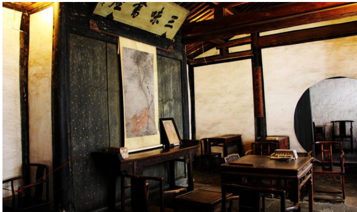
三味书屋 by ragweed

初中小学的时候背鲁迅的课文背到头疼，现在再想，那就是“天上飘来五个字，那都不是事儿”。每天都在发生的负面的事，同原来课本里讲的国人劣根性也没半毛钱关系，是人都有，纯粹是某些人想多了。