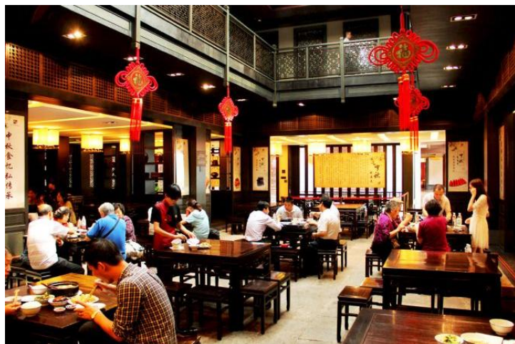
咸亨酒店