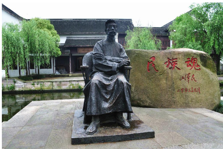
鲁镇里的鲁迅雕塑 by lovesg30