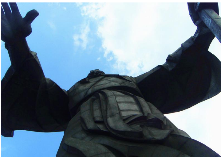
大禹立像 by lamifuding