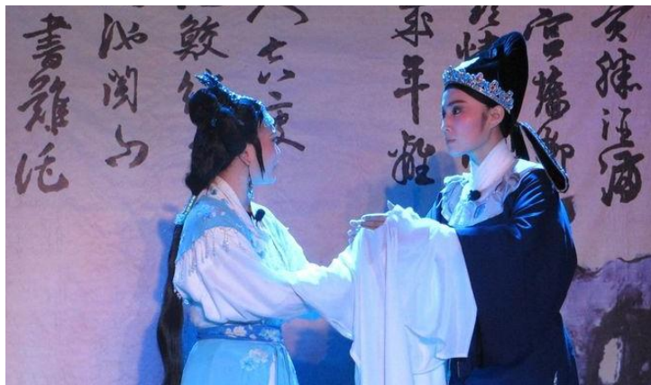
民族歌舞表演

忽高忽低的越剧唱腔，在柔柔的空气中左右飘荡，忆着陆游和唐婉的爱情故事，聆听沈园之音。不由一叹，相思的爱情都是相似的。