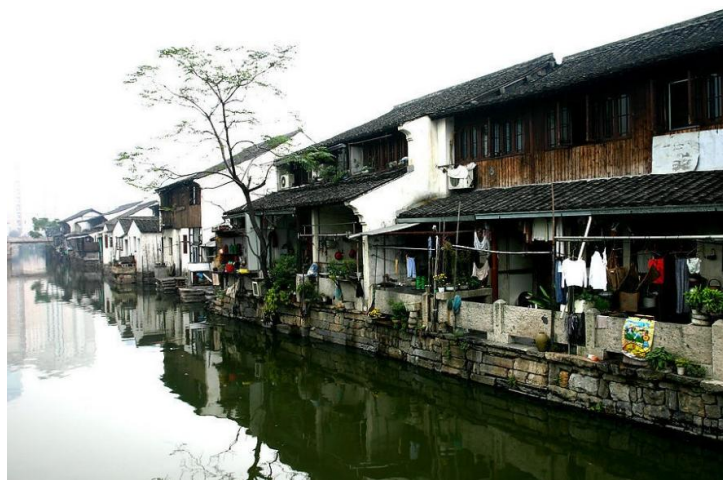
老街的河景

最后一天可以睡到自然醒，游览绍兴诸暨五泄风景区，山峦、异峰、竹楼、飞瀑，相得益彰。如果有更多时间，可以再去西施故里或安昌古镇畅游。