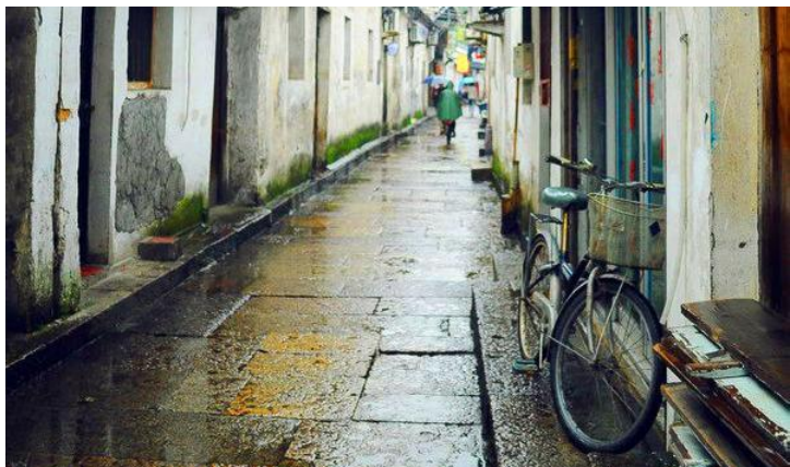
仓桥直街317号 by Mimo夏未未

窄窄的巷子，旧旧的石板路，潺潺的小桥流水，偶尔荡漾在水中的乌篷船。绍兴的老街如同杏黄酒一般，古韵悠悠，只是逛荡着，就倍感舒畅。