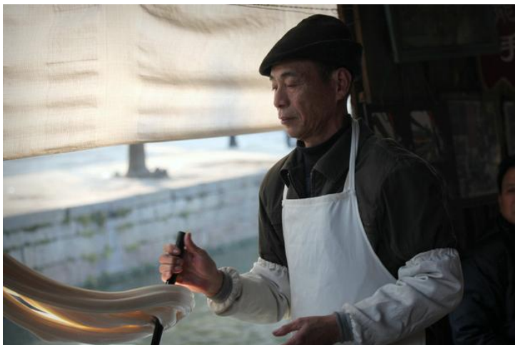
乌毡帽爷爷扯白糖 by 白颜料2块8

戴乌毡帽是绍兴人的一个鲜明标志。现在生产乌毡帽的主要原料是羊毛，易浸水，不易沾上污泥，戴在头上能遮风、挡雨，翻边处还用作夹烟、放钱。