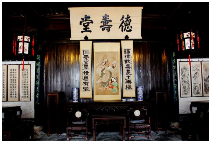
德寿堂 by ragweed

也可以登陆绍兴鲁迅纪念馆或绍兴市旅游官网预约免费门票，每天预约限额2000名，预约网址： www.shaoxingtour.cn/ticket/16.html