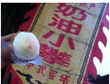
奶油小攀 by 昊Shi快乐先生

奶油小攀是一种类似蛋挞的绍兴特色小吃。奶油小攀像一个圆圆的白色礼帽。它有两部分组成。上面白白的像一座雪山。是用蛋清起泡沫后做成的。下面是像饼一样的皮，像一只小碗，是用面粉和鸡蛋和成后放入烤箱制成的。奶油小攀不但好看，而且好吃。