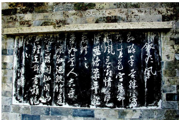
《钗头凤》 by ragweed

越剧起源于浙江省绍兴地区嵊县一带，并在浙江、上海、江苏等许多地区广为流传，是中国五大戏曲种类之一，已被列为国家级非物质文化遗产。越剧成型于清朝末年，是在曲艺“落地唱书”的基础上又融合了余姚滩簧等曲种的剧目、曲调以及表演艺术发展而来，那时叫做“小歌班”或是“笃班”。越剧的曲调清悠婉转，最善于抒情，主要分为尺调、四工调、弦下调三大类，其行当分为小旦、小生、老生、小丑、老旦、大面等六大类。