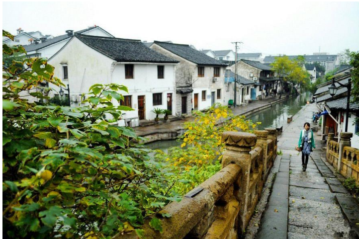
八字桥老街

目前绍兴的老街主要包括仓桥直街、西小河沿直街、八字桥直街、鲁迅故里、石门槛。乘坐三轮车或步行闲逛，顺带着摄影、喝酒、购物，着实不错！