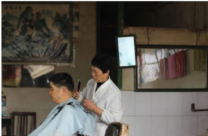
剪发 by helen_840709