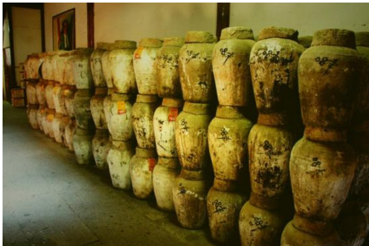
08年陈酿 by 刘锐涵19880102

南京出发，从市区开车出发上宁杭高速，经杭州绕城高速转沪杭甬高速往宁波方向，在绍兴出口下，即到绍兴，全程行驶约4小时。