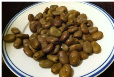
茴香豆 by 昊Shi快乐先生

鲁迅笔下的茴香豆，到了绍兴不可不尝。茴香豆原是绍兴民间比较普遍的“闲食”，由于价廉物美、经济实惠，逐步被城乡酒店作为四季常备的“过酒坯”。儿童、妇女也愿花点零钱一饱口福。因而茶馆、小摊也乐于这种小本经营，逐渐成为有浓郁乡土气息的风味特产。