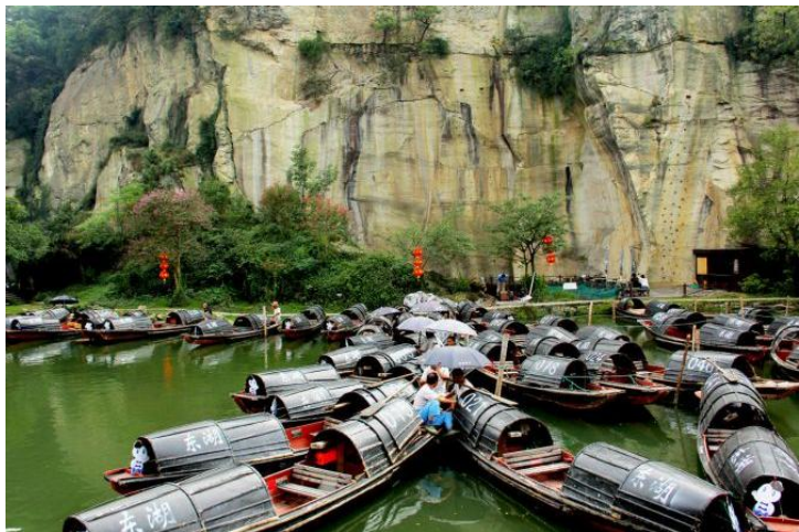
东湖的乌篷船 by ragweed

上午到绍兴，先乘车至东湖游览东湖风景区，坐乌篷、品黄酒、看社戏。后乘车至文豪诞生地鲁迅故里（鲁迅故居、百草园、三味书屋等），先在附近餐厅品尝地道的绍兴名菜，喝正宗的绍兴老酒，而后在景区内悠闲的逛荡。游玩结束，可以在景区门口乘大巴或去码头乘乌篷船至南宋名园——沈园，品味千古绝唱《钗头凤》，而后结束对绍兴的浅尝辄止之旅，前往下一个目的地。