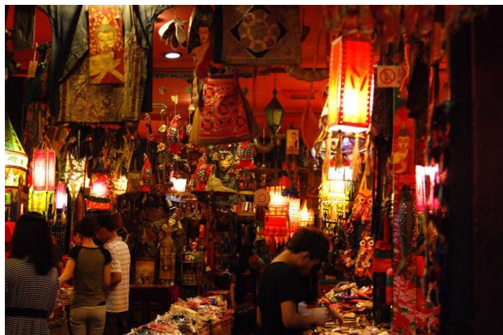
清河坊 by wei386

清河坊自古是杭州的繁华地段，是目前唯一保存完整的旧街区。杭州的百年老店，如王星记、张小泉、万隆火腿栈、胡庆余堂、方回春堂、叶种德堂、保和堂、状元馆、王润兴等均集中在这一带。带朋友一起穿行清河坊，很过眼瘾。