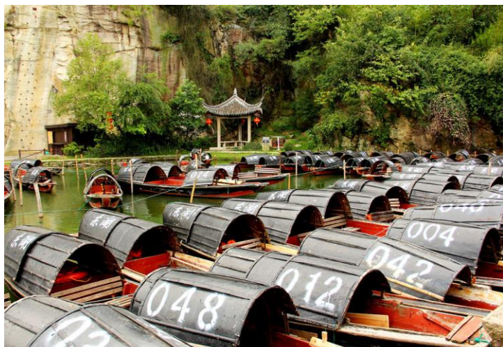
乌篷船 by ragweed