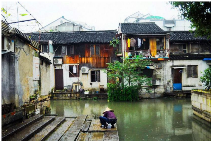
雨中的洗衣人 by Mimo夏未未