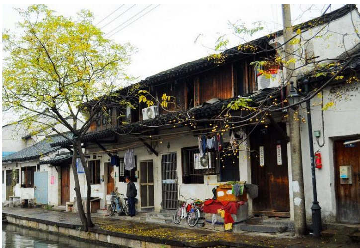
老街生活 by Mimo夏未末