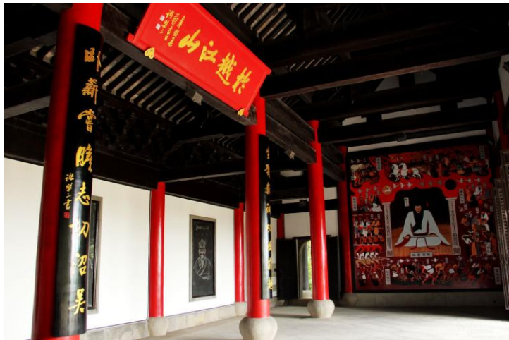
越王台 by ragweed