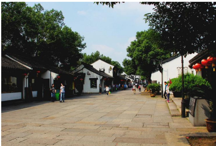
老街 by ragweed