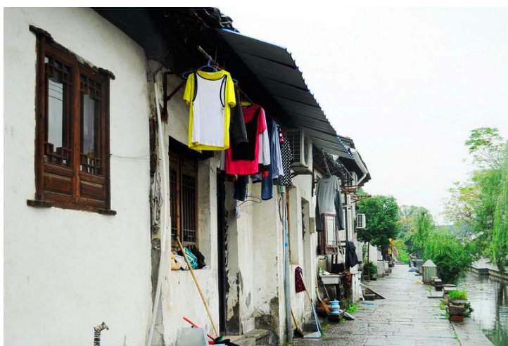
古朴的生活 by Mimo夏未末

西汉时期（公元前106年），增六县入会稽郡。东汉时期（公元129年），会稽郡拆分为两部分：会稽郡及吴郡，钱塘江以南为会稽郡。而今天的绍兴就隶属于当时的会稽郡。公元589年，隋文帝建吴州，改会稽郡为会稽县，会稽县隶属于吴州。而后吴州更名为绍兴府。在新中国成立起见，绍兴府更名为绍兴人民政府。1983年，绍兴被官方授予命名为绍兴市，隶属于浙江省。