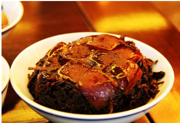
梅干菜扣肉 by ragweed

梅干菜（乌干菜）是绍兴一种价廉物美的传统副食品，也是绍兴的著名特产，生产历史悠久。绍兴梅干菜油光乌黑，香味醇厚，耐贮藏。用它做出来的梅干菜扣肉，肉又酥又入味，肥肉也不多。口味偏咸，很下饭。