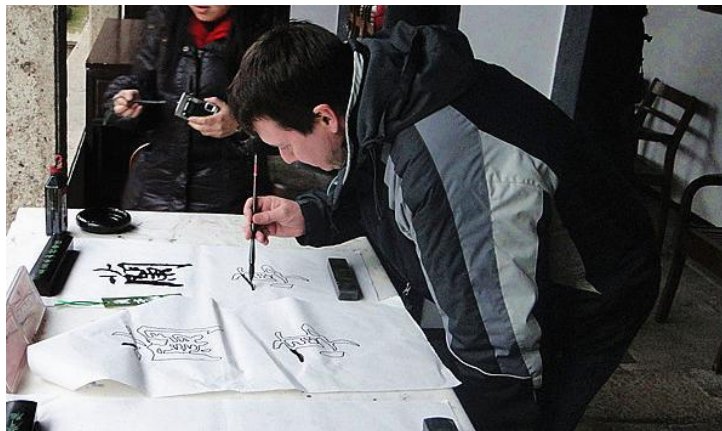
老外临摹“兰亭”

“兰亭临帖，行书如行云流水。月下门推，心细如你脚步碎……”哼唱着《兰亭序》悠游兰亭。满眼茂林修竹，清流激湍，相传越王勾践在此植兰，王羲之于此曲水流觞。