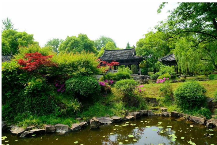
绿满沈园 by reton3