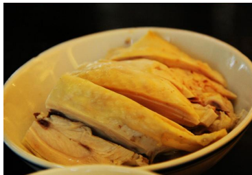
醉鸡 by ragweed

绍兴是花雕酒的著名产地。所谓近水楼台先得月，以花雕酒烹调而成的“醉鸡”也就成为江浙一带的名菜。“醉鸡”不但闻起来酒香扑鼻，吃起来鲜嫩多汁，而食后更是令人回味无穷。在闷热的夏天，能品尝到冰凉透心、酒味芳香的花雕醉鸡，的确是件赏心乐事！