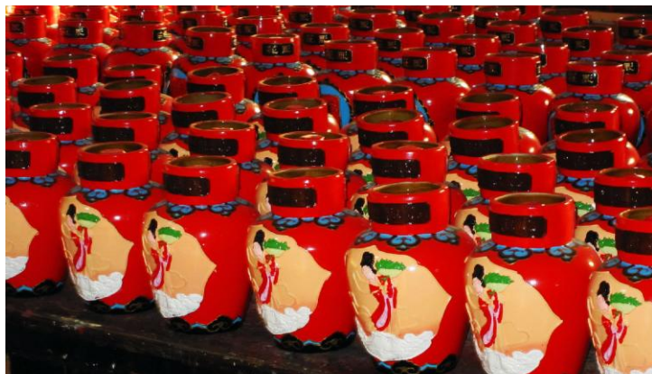
绍兴花雕

绍兴的黄酒跟水墨画一样的景致融为一体了，闻到酒味，就想到绍兴。靠河的老街酒馆里，温一壶黄酒，在青花酒盅里满满斟上一杯，小抿一口，浓郁的黄酒滑入喉中，香满唇齿间。