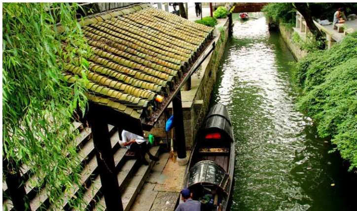
沈园乌篷 by ragweed

乌篷船是绍兴水乡的一道独特风景线。乘着乌篷船，徜徉在古色古香的绍兴老街，你已经走进了绍兴人的生活。