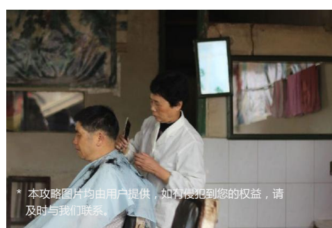
* 本攻略图片均由用户提供，如有侵犯到您的权益，请及时与我们联系。

特别感谢 以下用户的贡献： Mimo夏未末、ragweed、沫沫的行走、云淡风轻宁、蓝色宣言、月儿山魅、A水悠悠1、lamifuding、刘锐涵19880102、大皮球不动、reton3、xuyouzhen8029、lovesg30、昊Shi快乐先生、asmcvc、白颜料2块8、泡芙小金、helen_840709、垦颖孕粘茸怯、酥死晨、wei386（排名不分先后）