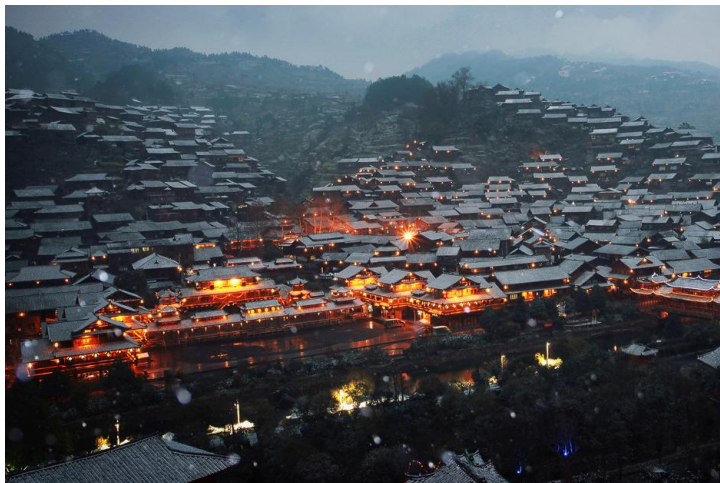
雪中的西江苗寨 by 叫我缪缪

西江有邮政储蓄和农村信用社，内均有ATM，支持银联卡取现，黔之驿精致旅舍里有农业银行的ATM取款机。西江是所有黔东南村寨中唯一一个有ATM的。