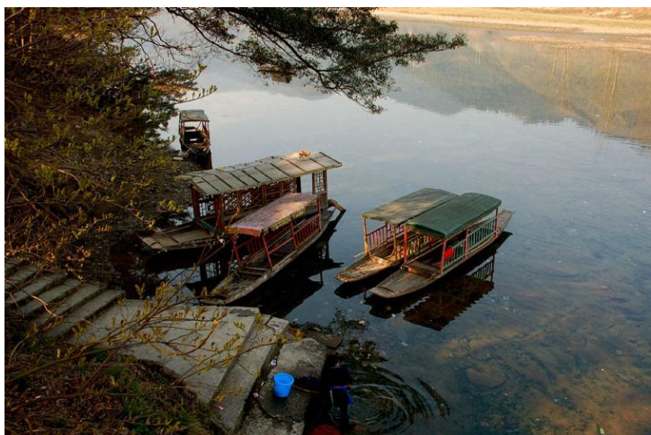
江边的小船 by蓝月_玩转西部