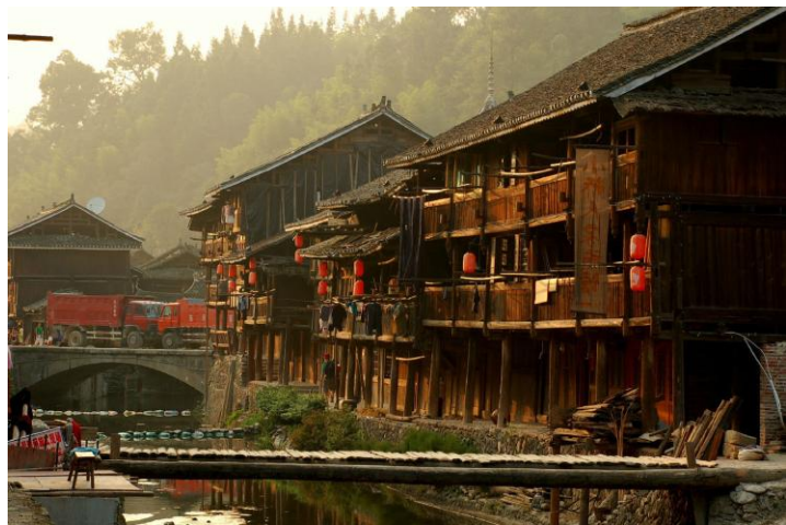
古老的侗寨吊脚楼 by 蓝月_玩转西部