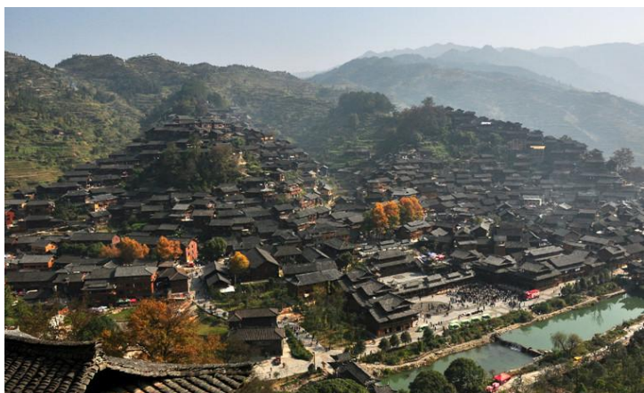
西江千户苗寨 by 蓝月_玩转西部

中国最美的湖叫西湖；中国最美的女人叫西施；中国最美的寨子就是眼前的西江了。白水河蜿蜒而过，滋养着千户苗寨的世代子民。