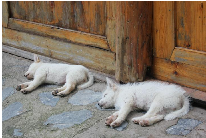
朗德睡觉的狗狗 by 那村那树那人

每天早上六点半有一班发往广西三江的班车；每天有20班发往湖南靖州的班车，最晚一班为下午六点；每天3班左右发往怀化的班车；每天20班左右与肇兴方向对开的班车；每天8班与凯里对开的班车；每天20班与榕江对开的班车，最晚一半为下午六点。