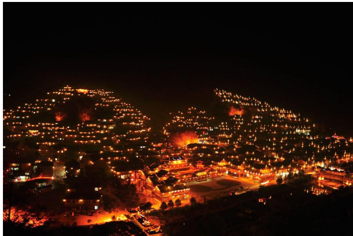
西江苗寨夜景