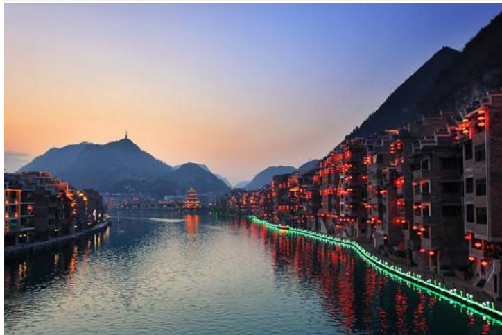
傍晚的镇远古城

历史悠久的古镇，依河而建，远观颇似太极图，融佛、儒、道三教文化内涵于一炉，各种古巷道、古民居、古码头相映成趣。