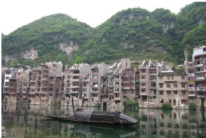
江上一舟 by 红辣椒chili