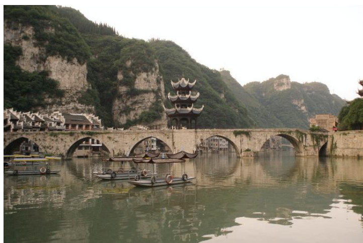
舞阳河畔 by mppapple