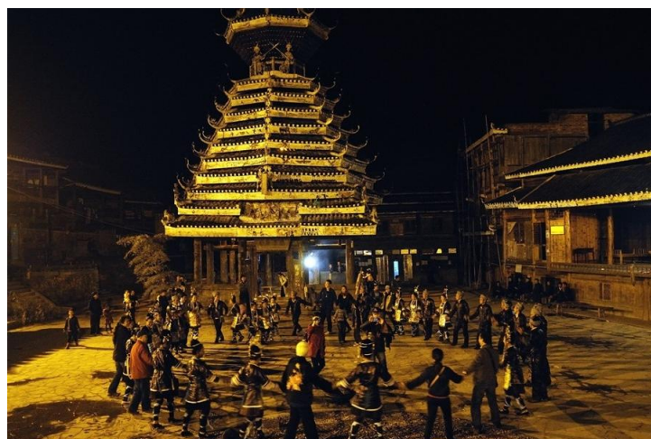
手拉手唱歌的人们

宰荡的精髓在于她的侗族大歌。如果说肇兴是黔东南旅行核心的话，宰荡在我们心中，是黔东南旅行的灵魂。