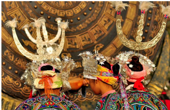
苗族服饰

黔东南州世居着苗族、侗族、水族、布依族、仡佬族、瑶族等10多个少数民族。全州400多万人口，其中少数民族就占了360多万，占总人口比例的80%还多。这么多的少数民族中，苗族和侗族是其中的主体，绝大部分的村寨都是苗寨侗寨。而水族、布依族、仡佬族、瑶族则零星地散布在各地，其中还有有待识别认定的单家人。