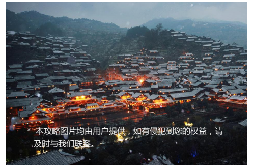
* 本攻略图片均由用户提供，如有侵犯到您的权益，请及时与我们联系。

蓝月_玩转西部、mppapple、清凉的雅雨、陌路jelly、zhuangbest、那村那树那人、红辣椒chili、August初七、小艾的艾、Sue苏陌、alick_li、Agun_ms、叫我缪缪（排名不分先后）