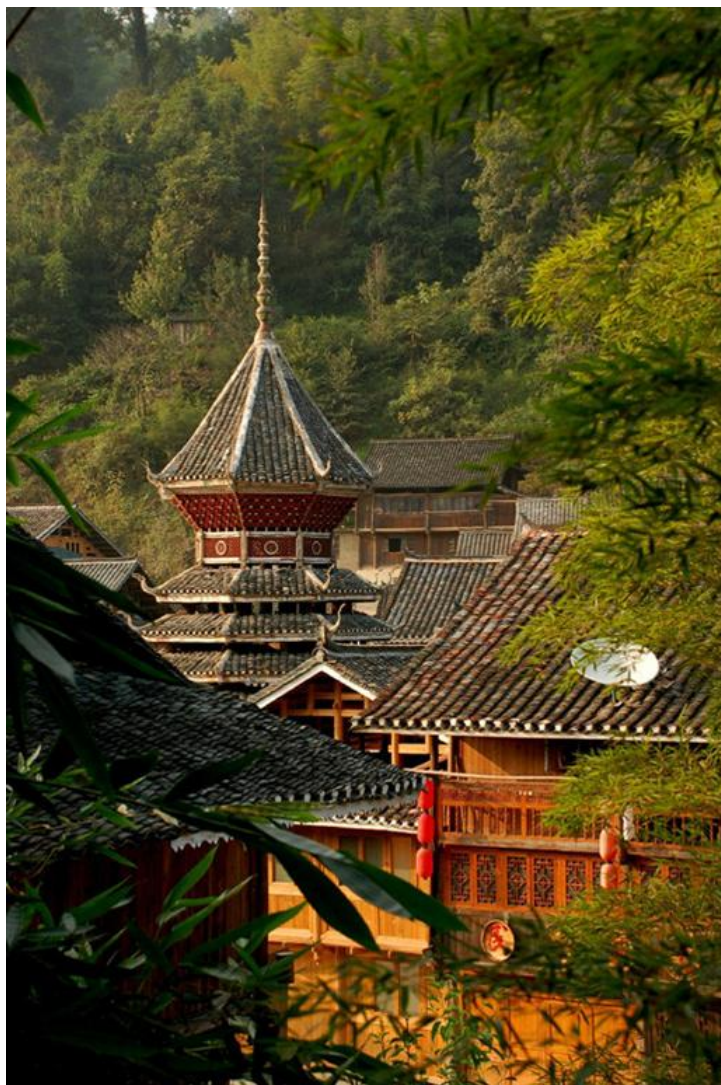
鼓楼顶 by 蓝月_玩转西部

我们打算在这里写一篇民族禁忌大全。随着本地人对外的交流渐渐频繁和旅行者的不断涌入，本地人和旅行者之间已经有了一定的相互了解，既不高高在上，也不妄自菲薄，平等交流在任何旅游地都是适用的。