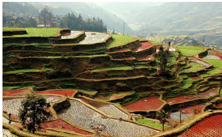
顺势而为的梯田

这些梯田中间均散落着苗乡独具特色的吊脚楼，犹如点缀在银河里的行星。逆光下的层层梯田有如面面明镜，一层层亮得耀眼，大者如曲池，小者似碎镜，依山势而层层弯曲，顺坡度而块块递进。