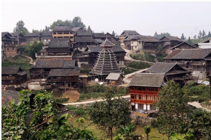
肇兴侗寨

肇兴古镇坐落于群山之间。远观重峦叠嶂，近看茂林修竹。两条源自山间的小河蜿蜒曲折，穿寨而过，清亮的溪水在古老的吊脚楼下欢腾跳跃，给古镇增添了许多灵性。