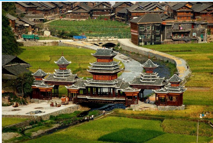
漂亮的风雨桥