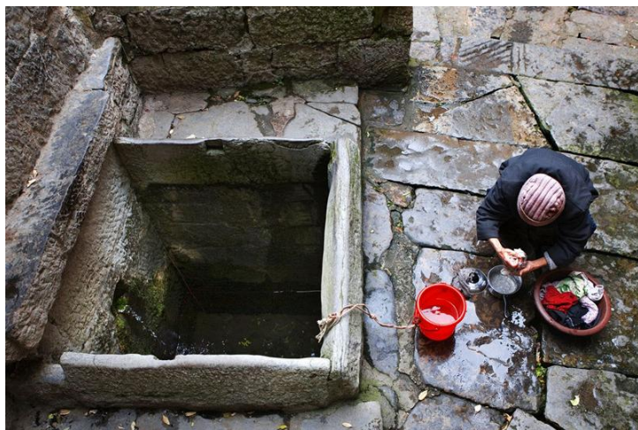
镇远四方井

这里的房屋造型和用途，别具一格，保留着传统干栏式风格和用途。在追求越洋越好的今天，不少地方洋房拔地而起，传统木房越来越少，木房面临消失。而该地仍保存清一色木房，并且是传统的干栏式房屋造型。