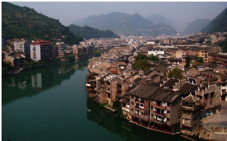
镇远古城

晚上睡在河边的房间里，隔江架空铁道火车呼啸而过，在空中划出一道光线，像极了宫崎骏动画《千与千寻》中的空中列车。