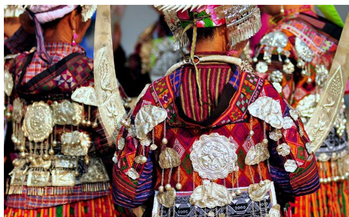
纷繁的装饰 by 蓝月_玩转西部

服饰上的每一片绣片，银饰上的每一个构件都可以构成一份非物质文化遗产，这是苗族服饰银饰的最主要的特征之一。