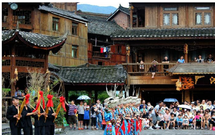
苗族表演

黔东南，有人称之为“百节之乡”，一年中大大小小节日集会有200多个。节日活动有唱歌跳舞、斗牛赛马、吹芦笙、踩铜鼓、赛龙舟、玩龙灯、唱侗戏等等，丰富多彩，各具特色。其中主要的民族节日有苗族的芦笙会、爬坡节、姐妹节，“四月八”、吃新节、龙舟节和苗族的苗年；还有侗族的侗年、泥人节、摔跤节、林王节，“三月三”歌节，以及水族的端午和瑶族的“盘王节”等等。